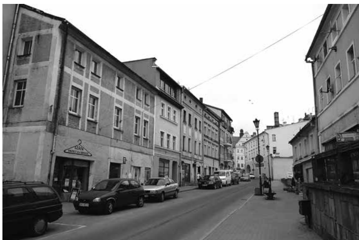
Ulica Kłodzka – widok spod budynku nr 9 w stronę Rynku.

Ulica Kłodzka – rozpoczyna prezentację dusznickich ulic z racji tradycyjnego znaczenia i wielowiekowej rangi. Opadająca od Rynku na wschód, wytyczona w kierunku miasta, którego nazwę nosi, już w pierwszej połowie XVIII wieku była największą zabudowaną w sposób ciągły ulicą Dusznik 25 . Do czasu budowy obwodnicy miejskiej w latach siedemdziesiątych XX wieku pełniła też funkcję głównej drogi wjazdowej 26 .