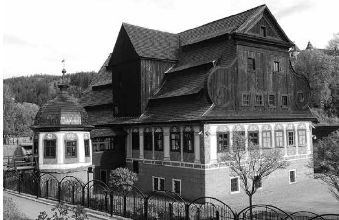
Dawny młyn papierniczy – siedziba Muzeum Papiernictwa.

Sąsiedztwo domów nr 32 i 34 jest wyrazem kontrastu form architektonicznych. Do trzykondygnacyjnej kamienicy w stylu neobarokowym z około 1875 roku (nr 32) 29 przylega powstały w latach siedemdziesiątych XX wieku pięciokondygnacyjny budynek plombowy o gładkich elewacjach, w typie bloku (nr 34).