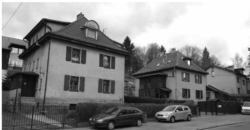
Fragment zabudowy willowej po wschodniej stronie ul. Sprzymierzonych.

Nr 11 – gmach dawnego szpitala, w latach 1902–1948 prowadzonego przez zakon elżbietanek, późniejszego Szpitala Rejonowego (obecnie nieczynnego). Obszerny budynek trzyskrzydłowy z ryzalitami posiada dwie kondygnacje i wysokie poddasze z mansardowym dachem. Główny korpus, zaprojektowany przez architekta z Wrocławia o nazwisku Hauck oraz Benno Müllera, oddano do użytku w 1902 roku 69 . Gmach rozbudowano według koncepcji z 1912 roku 70 .