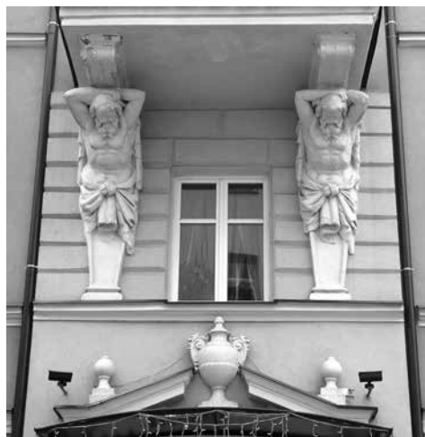
Fragment fasady budynku hotelu „Sonata”.

W trzeciej kondygnacji – głęboki balkon wsparty na konsolach z postaciami atlantów (popularny motyw w rzeźbie architektonicznej doby historyzmu). Naroża zaznaczone boniowaniem, w górnych partiach imitacja elementów filaru. Dawna architektura wnętrza nie zachowała się.