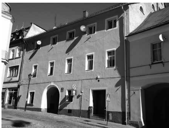
Dom przy ul. J. Słowackiego 2 – najstarszy budynek w Dusznikach.

Nr 2 – pierwszy murowany dom w Dusznikach i równocześnie najstarszy istniejący budynek w mieście. Dawny dom władców Homoli – Panowiczów 42 , pierwotnie renesansowy, z końca XVI wieku (w kłęczu nad bramą wjazdową zawsze widniał napis: „ANNO 1598” 43 ). Obiekt, w XIX wieku przebudowywany (zwłaszcza wewnątrz) mieścił aptekę, następnie hotel i browar 44 . W obecnej postaci trzykondygnacyjny z pięcioosiową fasadą.