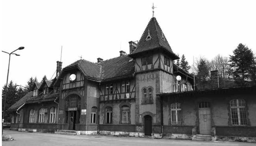
Budynek dworca kolejowego Duszniki-Zdrój.

Ulica Dworcowa – o nietypowej linii przebiegu: od ulicy Karola Świerczewskiego na północny zachód, następnie – po przecięciu końcowego odcinka ulicy Juliusza Słowackiego – niemal równolegle w przeciwną stronę, przy stacji kolejowej, do zbiegu z ulicą Kolejową.