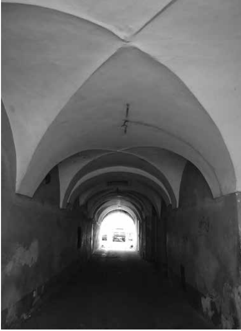
Sień przejazdowa domu przy ul. Słowackiego 2.

Znaczącym elementem założenia jest przejazd bramny – brukowany kostką, ze sklepieniem krzyżowym i kolebkowym z lunetami. W sklepieniu zachował się prostokątny otwór, przez który podawano bagaż gości hotelowych 45 .