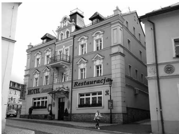
Hotel „Sonata” – reprezentacyjny gmach miasta.

Ulica Karola Świerczewskiego – o historycznej nazwie Lewińska ( Lewinerstraße ), wskazującej kierunek przebiegu. Wytyczona od Rynku na zachód, prowadzi w stronę zbocza Miejskiej Góry do dzielnicy Wapieninki, następnie w kierunku Lewina Kłodzkiego, Kudowy i Náchodu. Do strefy miejskiej Dusznik-Zdroju zalicza się fragment tego traktu. Zabudowa jest tu mocno zróżnicowana, najczęściej wolno stojąca.