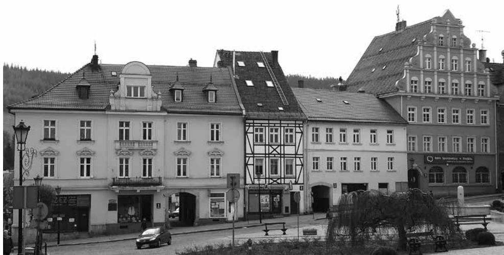
Rynek – strona południowo-wschodnia. Pierwszy z lewej – budynek dawnego zajazdu „Pod Czarnym Niedźwiedziem”.

Nr 4 – najwyższa kamienica w pierzei, zbudowana w latach dwudziestych XX wieku. Ustawiona szczytowo, wzorowana na wystawnych, późnorennesansowych i barokowych kamienicach mieszczańskich.