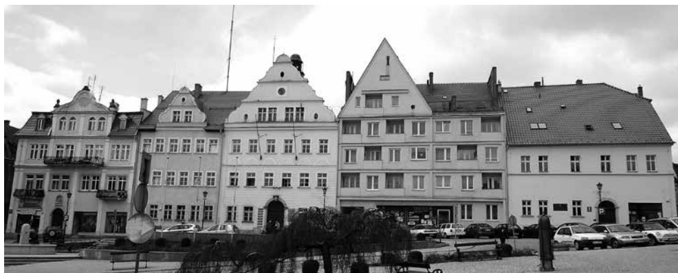
Rynek – strona południowo-zachodnia. Druga i trzecia kamienica od lewej tworzą łącznie gmach ratusza.

Nr 4 – najwyższa kamienica w pierzei, zbudowana w latach dwudziestych XX wieku. Ustawiona szczytowo, wzorowana na wystawnych, późnorennesansowych i barokowych kamienicach mieszczańskich.