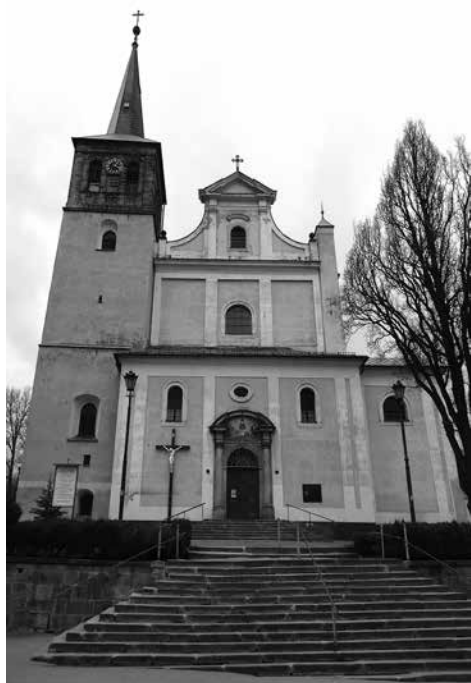
Kościół parafialny pw. św. św. Piotra i Pawła.

Kościół parafialny jest najlepiej wyeksponowanym akcentem architektonicznym staromiejskiej części Dusznik. Oprócz wysokości gmachu sprzyja temu wyniesienie terenu. Budynek, murowany z kamienia i cegły, oddzielony jest od ulicy murem oporowym i poprzedzony szerokimi schodami. Ustawiony jest nietypowo – na osi północ-południe (z fasadą i wejściem od południa) i wzniesiony na planie zbliżonym do krzyża łacińskiego, z wieżą przy narożniku południowo-zachodnim i aneksem z przeciwnej strony fasady. Od wschodu – kaplica na planie zbliżonym do kwadratu i zakrystia. Korpus przekryto dachem dwuspadowym, trzykondygnacyjną wieżę – spiczastym hełmem. Wnętrze – jednoprzestrzenne, z prezbiterium niższym od korpusu, sklepienie kolebkowo z lunetami. W południowej części nawy chór muzyczny ze sklepieniem krzyżowym. Fasada z wysuniętym przedsionkiem, trzyosiowa