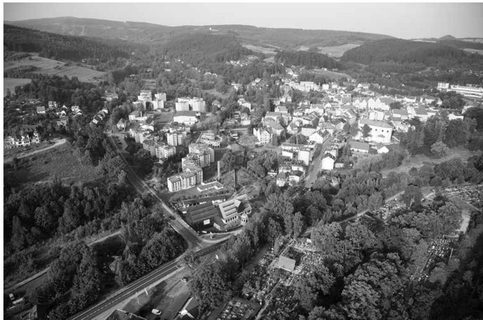
Panorama lotnicza Dusznik-Zdroju.

się barokowa wotywna kompozycja rzeźbiarska z datą 1685 w formie grotty z leżącą postacią św. Rozalii, pustelniczki i równocześnie orędowniczki chroniącej od zarazy 76 .