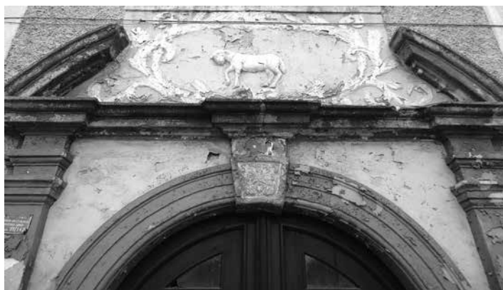
Fragment fasady dawnego domu cechu sukienników przy pl. Warszawy 4.

Nr 4 – położony w południowej części placu nad brzegiem Bystrzycy Dusznickiej dawny dom cechu sukienników wzniesiony w 1715 roku. Mieściła się tu farbiarnia, następnie w XIX wieku młyn zbożowy, istniejący co najmniej do 1902 roku, kiedy powstał przyległy dom przy ulicy Zdrojowej 64 . Oba budynki tworzą obraz harmonijnego sąsiedztwa różnych epok w architekturze.