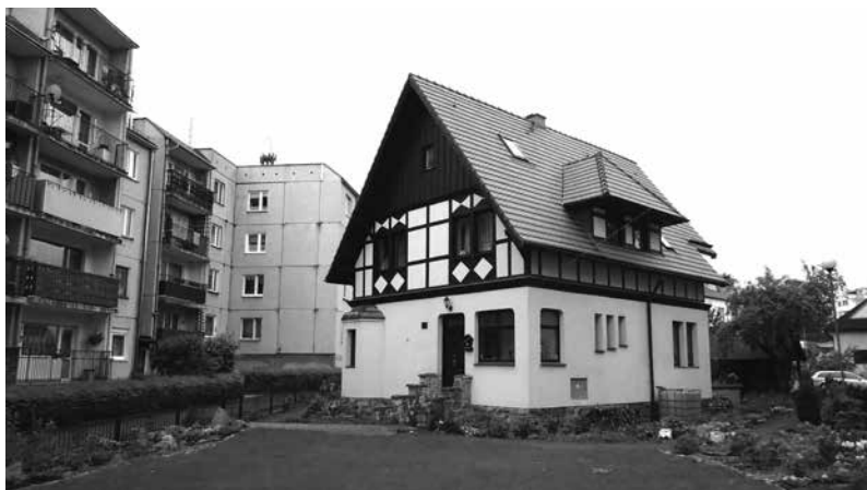
Stary budynek przy ul. Sportowej 5a w otoczeniu bloków osiedla Fryderyka Chopina II.

Ulica Sportowa – łączy ulicę Bohaterów Getta i ulicę Sprzymierzonych, tworząc oś przedzielającą osiedla bloków mieszkalnych – od południa osiedle Fryderyka Chopina I i od północy osiedle Fryderyka Chopina II.