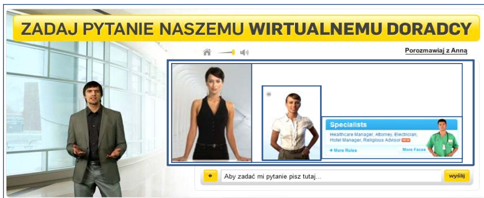
Rys. 3. Wirtualni agenci – przykłady

To, czy odpowiedzi agenta zgodne są z oczekiwaniami użytkownika (co do ich formy oraz zawartości merytorycznej), zależy zarówno od treści, jak i sposobu generowania wypowiedzi. Ponadto wygląd i zachowanie agenta tworzą znaczną część UX użytkownika, a cechy i zachowania agenta niewłaściwie dobrane do specyfiki firmy/serwisu nie tylko mogą obniżyć zaufanie użytkownika do wypowiedzi samego agenta, ale także przełożyć się negatywnie na wiarygodność serwisu/firmy oraz jej wizerunek. Z badań UX oczekiwanego wynika w oczywisty sposób, że użytkownicy oczekują innego typu osobowości i zachowań np. od agenta kancelarii prawniczej, od agenta usług medycznych czy od wirtualnego doradcy z zakresu prac instalatorsko-budowlanych (rys. 3).