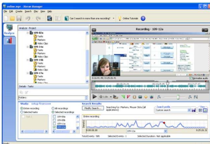
Rys. 1. Fragment badania User Experience opartego na testach użyteczności, prowadzonego z wykorzystaniem oprogramowania analitycznego Techsmith Morae