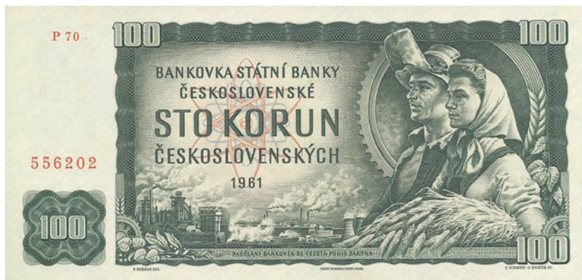
Fot.19a. 100 korun emisji z 1961 roku (awers), zbiory Muzeum Papiernictwa, sygn. MD 1067 N

symbolika. Jest to umieszczony w lewym dolnym rogu przedniej strony nominału sierp i młot. Ten sam motyw znajduje się w prawym dolnym rogu na tylnej stronie tego banknotu.