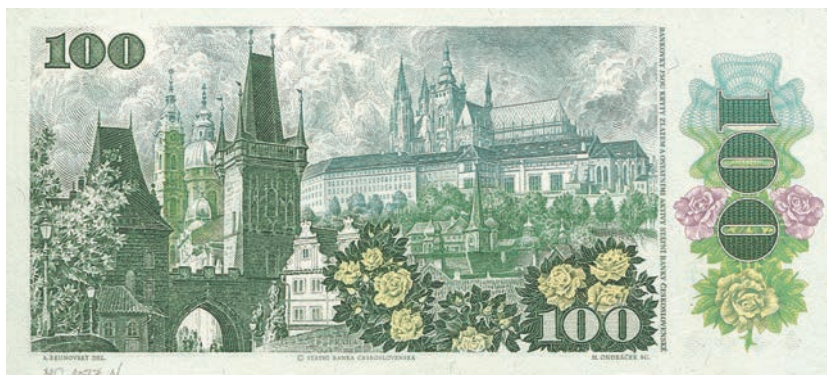
Fot. 22b. 100 korun emisji z 1989 roku (rewers), zbiory Muzeum Papiernictwa, sygn. MD 1077 N

wacji Klementa Gottwalda 47 . Nominał ten jest tradycyjnie utrzymany w zieleniach. Na przedniej stronie obok portretu przywódcy znajduje się stylizowana czerwona gwiazda, z której „wyrasta” herb Czechosłowackiej Republiki Socjalistycznej (fot. 22a). Na tylnej stronie nominału umieszczone zostało przedstawienie Pragi. W przeciwieństwie do emitowanych wcześniej nominałów na pierwszym planie widnieje fragment Mostu Karola w postaci grupy rzeźbiarskiej ukazanej na tle Bramy Prochowej (fot. 22b). Co ciekawe, nad całością góruje świątynia chrześcijańska – katedra Świętego Wita na Hradczanach będąca siedzibą arcybiskupów praskich i prymasa Czech. Banknot o nominale 100 korun z podobizną Klementa Gottwalda