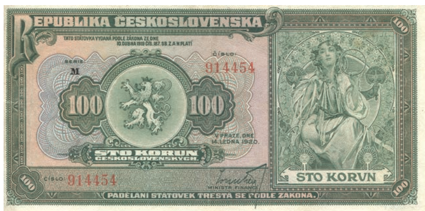
Fot. 1a. 100 koron emisji z 14 stycznia 1920 roku (awers), zbiory Muzeum Papiernictwa, sygn. MD 826 N