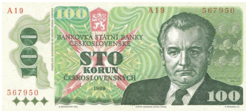
Fot. 22a. 100 korun emisji z 1989 roku (awers), zbiory Muzeum Papiernictwa, sygn. MD 1077 N