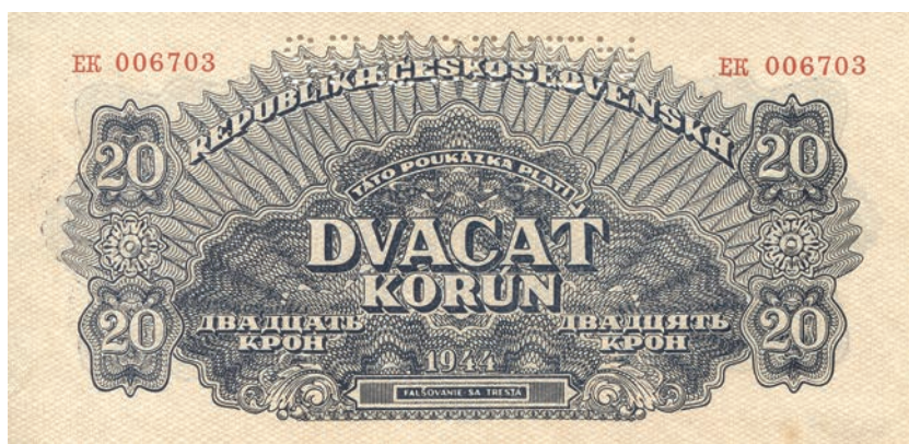
Fot. 9a. 20 koron emisji z 1944 roku (SPECIMEN) (awers), zbiory Muzeum Papiernictwa, sygn. MD 897 N

gnatura angielskiej drukarni Thomas de la Rue & Company Limited, London 36 . Po zakończeniu II wojny światowej do Czechosłowacji wróciły przedwojenne władze. Prezydentem został ponownie Edvard Beneš. Wydrukowane na emigracji banknoty zostały wprowadzone do obiegu na początku listopada 1945 roku i były ważne do końca maja 1953 roku. Po przeprowadzonym w lutym 1948 roku komunistycznym zamachu stanu przygotowano nowsze wersje banknotów z zachowaniem ogólnego schematu kompozycyjnego nominałów 5 i 10. Na każdym z nich pojawiła się data emisji oraz zniknęły sygnatury angielskiej drukarni. Zmianie uległa szata graficzna tylnej strony nominału 50 koron. Na wydrukowanym podczas wojny banknocie dominującym elementem był tam herb Republiki Czechosłowackiej, który w 1948 roku zastąpiony został widokiem Bańskiej Bystrzycy na Słowacji.