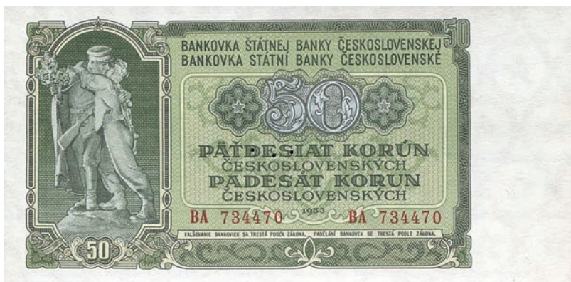
Fot. 13a. 50 koron emisji z 1953 roku (awers), zbiory Muzeum Papiernictwa, sygn. MD 1057 N