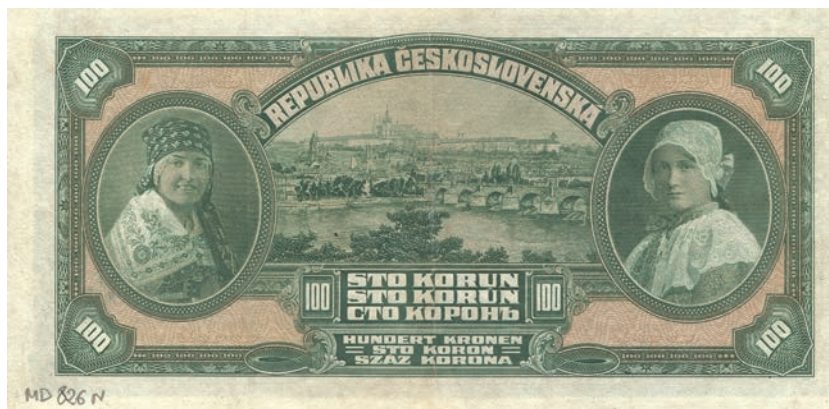
Fot. 1b. 100 koron emisji z 14 stycznia 1920 roku (rewers), zbiory Muzeum Papiernictwa, sygn. MD 826 N