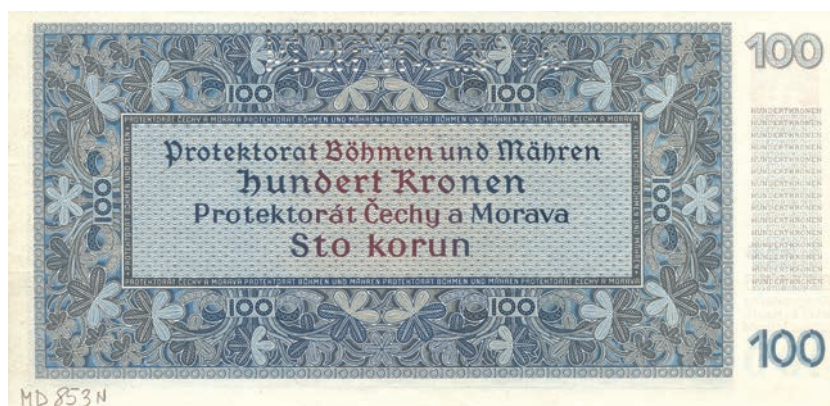
Fot. 7b. 100 korun emisji z 20 sierpnia 1940 roku (SPECIMEN) (rewers), zbiory Muzeum Papiernictwa, sygn. MD 853 N