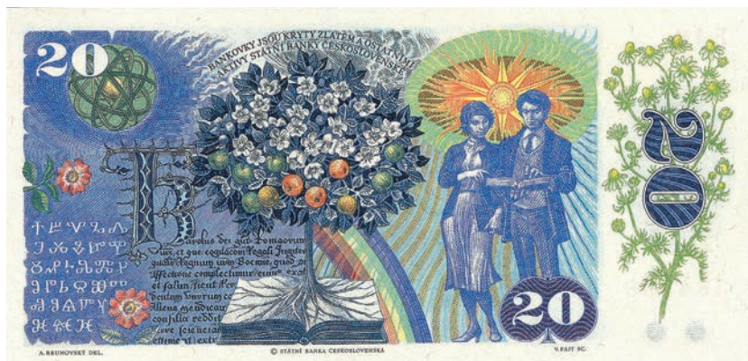
Fot. 21b. 20 korun emisji z 1988 roku (rewers)

z 1964 roku, w kolistą sferę umieszczoną nieomal w geometrycznym środku awersu. Na 100 korunach jest to model atomu stanowiący element poddruku dla informacji o nominale. Ukazany model jest wizją nowoczesności – energii czerpanej z atomu.