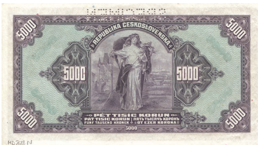
Fot. 5b. 5000 koron emisji z 6 lipca 1920 roku (SPECIMEN) (rewers), zbiory Muzeum Papiernictwa, sygn. MD 828 N

Drugim ze wspomnianych nominałów, które powstały za oceanem, jest 5000 koron emisji z 6 lipca 1920 roku. Jest to banknot o dużym formacie wykonany z użyciem charakterystycznych dla nowojorskiej wytwórni ozdobnych giloszy. Na przedniej stronie znajdują się dwa owalne pola (fot. 5a). W większym, umieszczonym centralnie, ukazana została rzeka Łaba z widoczną w oddali górą Říp. Na rzece