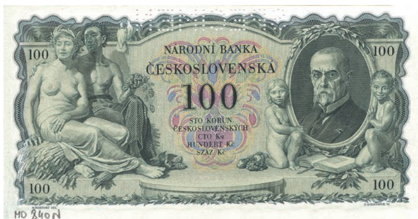
Fot. 6b. 100 koron emisji z 10 stycznia 1931 roku (SPECIMEN) (rewers), zbiory Muzeum Papiernictwa, sygn. MD 840 N