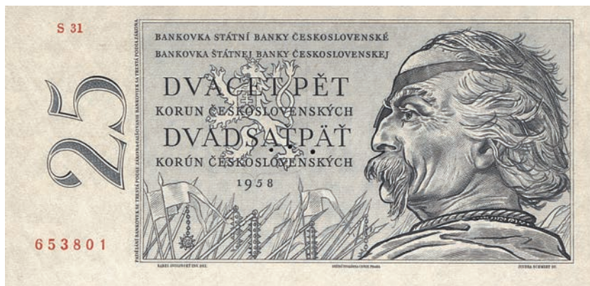
Fot. 16. 25 korun emisji z 1958 roku (awers), zbiory Muzeum Papiernictwa, sygn. MD 1061 N