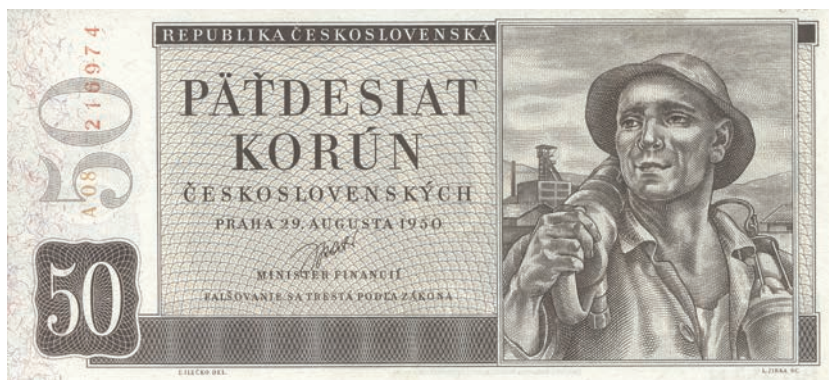
Fot. 11a. 50 koron emisji z 29 sierpnia 1950 roku (awers), zbiory Muzeum Papiernictwa, sygn. MD 643 N

Były ważne stosunkowo krótko. Wycofano je z końcem października 1945 roku. Jedynie 1 korona pozostała prawnym środkiem płatniczym do 13 kwietnia 1946 roku. Gdy zestawimy ze sobą banknoty przeznaczone dla Czechosłowacji, Polski, Rumunii i Węgier, to dostrzeżemy powtarzające się schmeaty rysunku różnych nominałów. Na przykład nominały 20 koron i 10 złotych mają zbliżony układ graficzny awersu (por. fot. 9a z fot. 10a) oraz rewersu (por. fot. 9b z fot. 10b). Rewers 5 koron jest zbliżony do awersu 50 groszy. Przednia strona 500 i 100 koron odpowiada w ogólnym układzie stronie głównej polskich banknotów o nominałach 20 i 50 złotych. Natomiast tylna strona nominału 500 koron odpowiada rewersowi 100 złotych 37 .