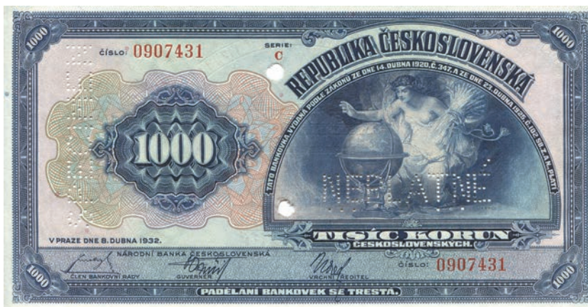
Fot. 3a. 1000 korun emisji z 8 kwietnia 1932 roku (NEPLATNÉ) (awers), zbiory Muzeum Papiernictwa, sygn. MD 841 N

tywy solarne znane z przedstawienia Slavii ukazanego na 100 koronach emisji z 14 stycznia 1920 roku. Artysta wkomponował je w umieszczonym na rewersie węższym polu jako element dekoracji między winietą z wartością nominalną a polem z portretem personifikacji republiki.