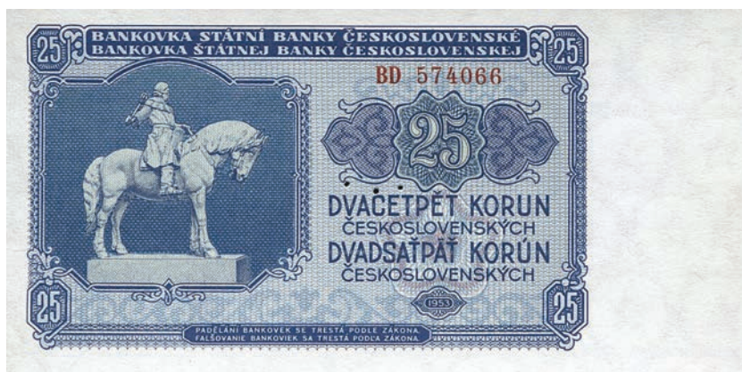
Fot. 15. 25 korun emisji z 1953 roku (awers), zbiory Muzeum Papiernictwa, sygn. MD 1055 N