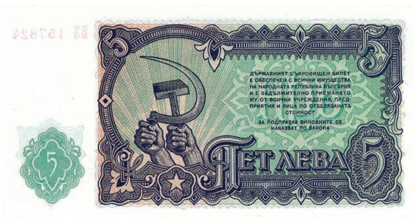
Fot. 20. Bułgaria, 5 lewa emisji z 1951 roku (rewers)

50 koron emisji z 1964 roku, przedstawione są w stylistyce socrealistycznej. Na rewersie znajduje się widok Pragi z Mostem Karola i widocznymi w tle Hradczanami z katedrą Świętego Wita (fot. 19b). Podobnie jak na 50 koronach również i w tym przypadku w lewym dolnym rogu umieszczona została radziecka symbolika – skrzyżowane sierp i młot. Wśród europejskich państw należących do bloku wschodniego symbol ten stanowi dominantę tylnej strony dwóch bułgarskich nominałów – 3 i 5 lewa emisji z 1951 roku (fot. 20). U dołu banknotu widać kolaż złożony z zabudowań różnych zakładów przemysłowych, fabryk i kopalni. Z wkomponowanych na tej stronie nominału kominów leci dym, co sugeruje nieustanną pracę. Ukazana na awersie para wpatrzona jest, podobnie jak mężczyźni z nominału 50 koron emisji