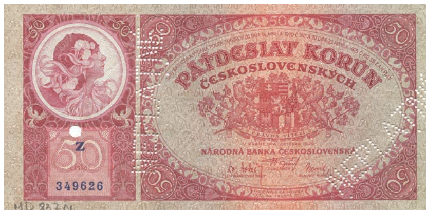
Fot. 2a. 50 koron emisji z 1 października 1929 roku (NEPLATNÉ) (awers), zbiory Muzeum Papiernictwa, sygn. MD 837 N