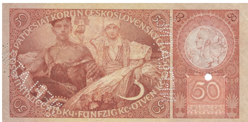
Fot. 2b. 50 koron emisji z 1 października 1929 roku (NEPLATNÉ) (rewers), zbiory Muzeum Papiernictwa, sygn. MD 837 N

zwalają widzieć w niej personifikację rolnictwa. W tle, za prawą ręką mężczyzny, dostrzec można kozi łeb. Na tym banknocie jest to realistyczne przedstawienie zwierzęcia. Na wspomnianych wcześniej 100 i 500 koronach ukazany schematycznie kozi łeb stanowi element dekoracyjny. Poza odwołaniami do gospodarki znajdziemy również nawiązanie do nauki. Wspomniany mężczyzna opiera lewą rękę o książkę. Natomiast symbolizująca rolnictwo kobieta ubrana w czeski strój ludowy trzyma w prawej ręce sadzonkę drzewa z liśćmi lipy. Te przypominające serce liście stały się nieodzownym elementem ikonografii oficjalnej w Czechosłowacji do końca istnienia tego państwa. Znajdziemy je na czechosłowackich monetach i banknotach, jako element odznak wojskowych itp. Liście lipy widzimy przy kobiecym portrecie znajdującym się z prawej strony rewersu. Całość banknotu wypełniają utrzymane w secesyjnej stylistyce motywy floralne. Na rewersie dojrzeć można również mo-