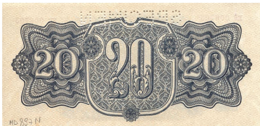
Fot. 9b. 20 koron emisji z 1944 roku (SPECIMEN) (rewers), zbiory Muzeum Papiernictwa, sygn. MD 897 N