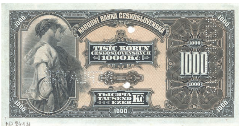
Fot. 3b. 1000 korun emisji z 8 kwietnia 1932 roku (NEPLATNÉ) (rewers), zbiory Muzeum Papiernictwa, sygn. MD 841 N

W American Bank Note Company w Nowym Jorku powstały jeszcze inne nominały. Dwa z nich – 1000 korun emisji z 15 kwietnia 1919 (druga emisja z 8 kwietnia 1932 roku) oraz 5000 korun emisji z 6 lipca 1920 roku – zasługują na szczególną uwagę. Dominantą szaty graficznej pierwszego z nich (fot. 3a) stanowi przedstawienie półnagiej kobiety klęczącej przy globusie, które zostało wpisane w półkoliste pole.