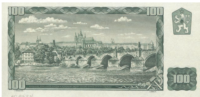
Fot.19b. 100 korun emisji z 1961 roku (rewers), zbiory Muzeum Papiernictwa, sygn. MD 1067 N

Zachowanie ładunku ideologicznego miało również miejsce w przypadku nominału 100 korun. Symbolizujący sojusz robotniczo-chłopski mężczyźni zostali zastąpieni parą – hutnik i chłopka (fot. 19a), którzy stanowią dominantę przedniej strony nominału. Za postaciami wzorem chrześcijańskiej ikonografii właściwej dla patronów różnych zawodów znajduje się wzorowany na aureoli okrąg. Tworzy go widoczny przed twarzą mężczyzny fragment koła zębatego, a za głową kobiety kłos zboża. Postacie te, podobnie jak mężczyźni ze wspomnianego wcześniej nominału