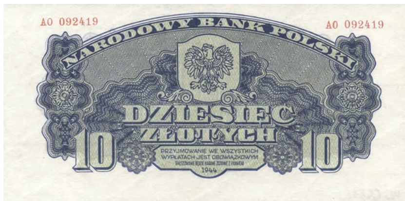
Fot. 10a. 10 złotych emisji z 1944 roku (awers), zbiory Muzeum Papiernictwa, sygn. MD 643 N