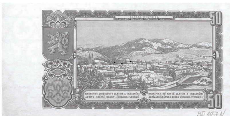
Fot. 13a. 50 koron emisji z 1953 roku (rewers), zbiory Muzeum Papiernictwa, sygn. MD 1057 N