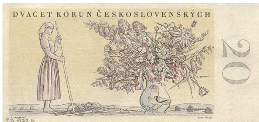
Fot. 12b. 20 korun emisji z 1 maja 1949 roku (rewers), zbiory Muzeum Papiernictwa, sygn. MD 932 N

Motywy socrealistyczne zagościły na banknotach czechosłowackich ponad cztery lata później niż na banknotach polskich, bo dopiero pod koniec 1950 roku. W przypadku polskich pieniędzy papierowych miało to miejsce, począwszy od lipca 1946 roku. W Czechosłowacji pierwszym banknotem mającym w szacie graficznej wyraźne konotacje z socrealizmem było 50 korun emisji z 29 sierpnia 1950 roku. Autorami projektu graficznego byli Ludovít Ilečko i Ladislav Jirka. Na przedniej stronie tego nominału wkomponowany został portret górnika (fot. 11a). Umieszczone na banknotach państw socjalistycznych przedstawienia górników reprezentują przemysł wydobywczy. Nominał ten odbiega stylistycznie od emitowanych uprzednio w Czechosłowacji banknotów o bogatej szacie graficznej. Na tym pieniądzu papierowym przedstawienie górnika jest najbardziej rozbudowanym pod względem ikonograficznym wizerunkiem przedstawiciela tej grupy zawodowej, jakie znalazło