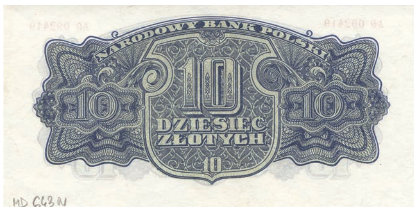
Fot. 10b. 10 złotych emisji z 1944 roku (rewers), zbiory Muzeum Papiernictwa, sygn. MD 643 N