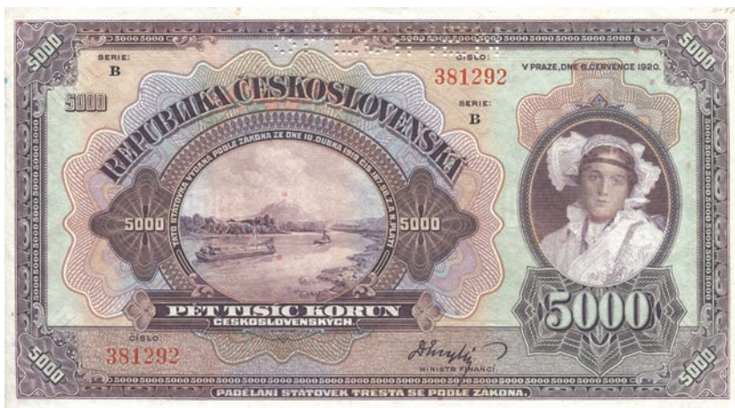
Fot. 5a. 5000 koron emisji z 6 lipca 1920 roku (SPECIMEN) (awers), zbiory Muzeum Papiernictwa, sygn. MD 828 N

Dodatkowo przedstawienie to znalazło się na: nikaraguańskim banknocie 50 corobas 1934 oraz na dwóch peruwiańskich banknotach 5 soles 1935 i 50 soles 1950 (fot. 4).