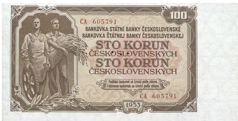
Fot. 14a. 100 koron emisji z 1953 roku (awers), zbiory Muzeum Papiernictwa, sygn. MD 1059 N