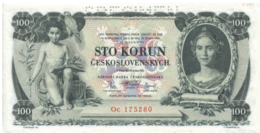
Fot. 6a. 100 koron emisji z 10 stycznia 1931 roku (SPECIMEN) (awers), zbiory Muzeum Papiernictwa, sygn. MD 840 N

widzimy holownika ciągnący baręk, a w oddali z prawej strony jadący pociąg. Natomiast we wkomponowanym z prawej strony awersu medalionie znajduje się portret dziewczyny ubranej w strój charakterystyczny dla miasta Tabor. Dominantę drugiej strony banknotu stanowi umieszczone centralnie pole (fot. 5b). W nim wkomponowana została alegoryczna kobieca postać ubrana w ponadczasowe szaty, która w lewej ręce trzyma róg obfitości, a w prawej kiść winogron. Te atrybuty pozwalają widzieć w kobiecie rzymską boginię szczęścia Fortunę 30 . Postać została ukazana