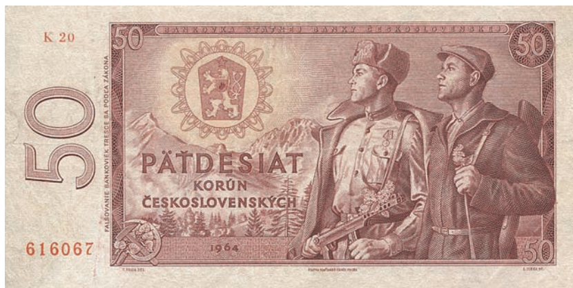
Fot. 18. 50 koron emisji z 1964 roku (awers), zbiory Muzeum Papiernictwa, sygn. MD 1069 N

kiem płatniczym. 25 koron emisji z 1958 roku wycofano z obiegu z końcem 1971 roku, a emisję z 1961 roku rok później.