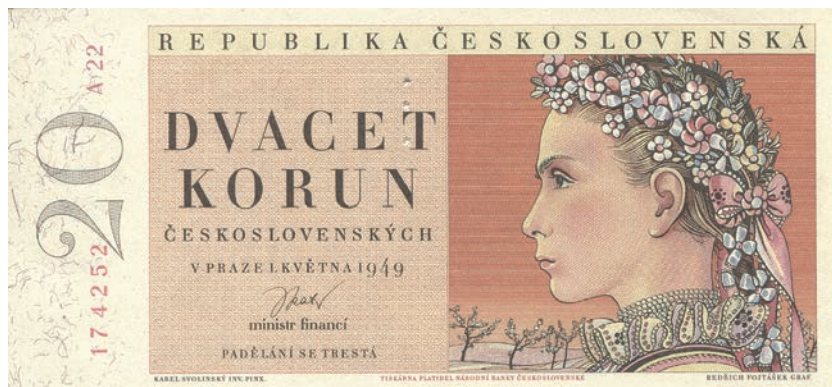
Fot. 12a. 20 korun emisji z 1 maja 1949 roku (awers), zbiory Muzeum Papiernictwa, sygn. MD 932 N