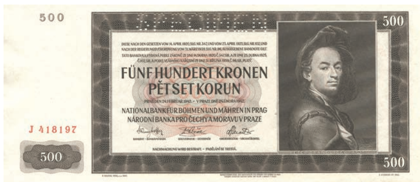
Fot. 8. 500 koron emisji z 24 lutego 1942 roku (SPECIMEN) (awers), zbiory Muzeum Papiernictwa, sygn. MD 858 N

Na nominałach 50, 500, 1000 i 5000 koron znajdują się wykonane bardzo dobrze pod względem graficznym portrety, które stanowią dominantę przedniej strony każdego z nominałów i odciągają uwagę od pozostałej części banknotu. Na szczególne wyróżnienie zasługuje autoportret czeskiego malarza późnobarokowego Petera Brandla (1668-1735) umieszczony na utrzymanym w brązach nominale 500 koron emisji z 24 lutego 1942 roku (fot. 8). Wkomponowanie w szatę graficzną