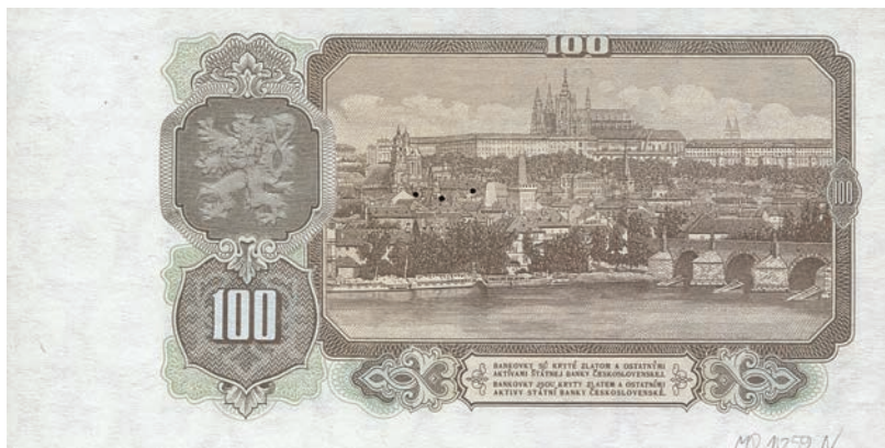
Fot. 14b. 100 korun emisji z 1953 roku (rewers), zbiory Muzeum Papiernictwa, sygn. MD 1059 N

wydrukowany został w brązach, przez co różni się kolorystyką od tradycyjnej zieleni zarezerwowanej dla tego nominału. Zachowano natomiast panoramę Pragi z Mostem Karola i Hradczanami, która jest również charakterystycznym motywem dla czechosłowackich banknotów o nominale 100 korun.