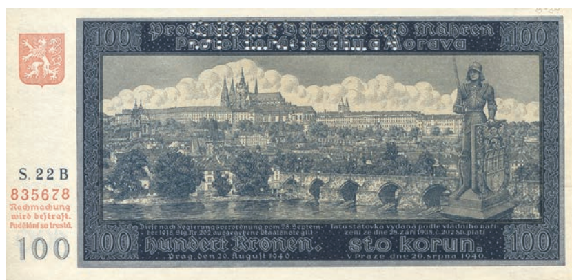
Fot. 7a. 100 korun emisji z 20 sierpnia 1940 roku (SPECIMEN) (awers), zbiory Muzeum Papiernictwa, sygn. MD 853 N

siedząca na snopie zbóż kobieta oraz trzymający szyszki chmielu mężczyzna (fot. 6b). Kobieta ma na głowie wieniec z kłosów zbóż, a spod jej nóg wystaje kolba kukurydzy. Podobnie jak dziecku z przedniej strony banknotu postaciom towarzyszy element ornitologiczny. Powyżej nich na giloszowej ramie przycupnęły dwa gołębie – symbol zakochanych, który w tym przypadku można odczytywać jako związek dwóch narodów: czeskiego i słowackiego. Z prawej strony znalazła się owalna rama z portretem ojca niepodległej Czechosłowacji Tomáša Masaryka podtrzymywana przez dwoje dzieci. Poniżej ramy leży otwarta księga oraz podobnie jak na przedniej stronie nominału znajdują się owoce i gałązka laurowa uzupełniające kompozycję rewersu.