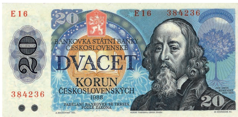
Fot. 21a. 20 koron emisji z 1988 roku (awers)

50 koron emisji z 1964 roku, przedstawione są w stylistyce socrealistycznej. Na rewersie znajduje się widok Pragi z Mostem Karola i widocznymi w tle Hradczanami z katedrą Świętego Wita (fot. 19b). Podobnie jak na 50 koronach również i w tym przypadku w lewym dolnym rogu umieszczona została radziecka symbolika – skrzyżowane sierp i młot. Wśród europejskich państw należących do bloku wschodniego symbol ten stanowi dominantę tylnej strony dwóch bułgarskich nominałów – 3 i 5 lewa emisji z 1951 roku (fot. 20). U dołu banknotu widać kolaż złożony z zabudowań różnych zakładów przemysłowych, fabryk i kopalni. Z wkomponowanych na tej stronie nominału kominów leci dym, co sugeruje nieustanną pracę. Ukazana na awersie para wpatrzona jest, podobnie jak mężczyźni z nominału 50 koron emisji