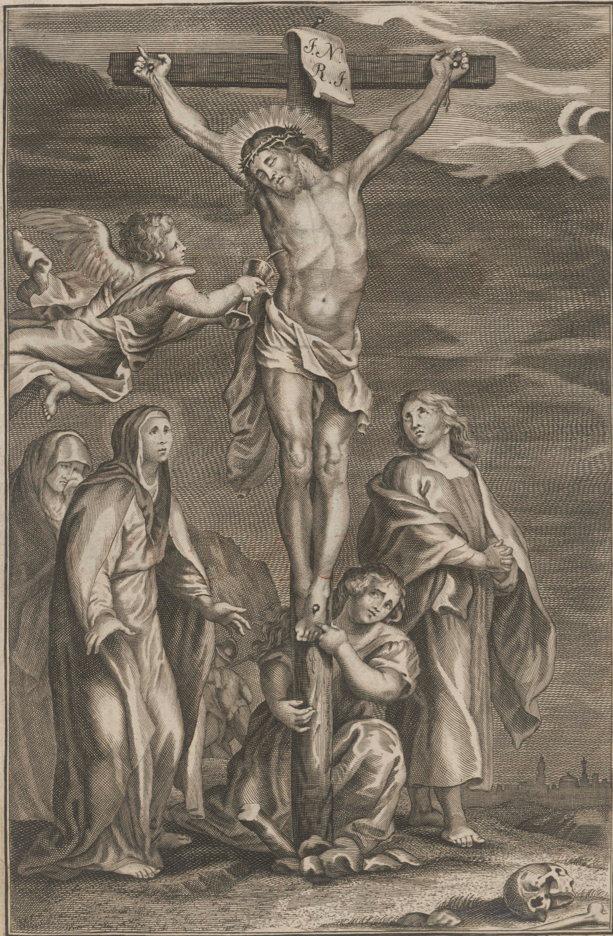
Bart. Strahovsky scul. V. V. Bratislava.