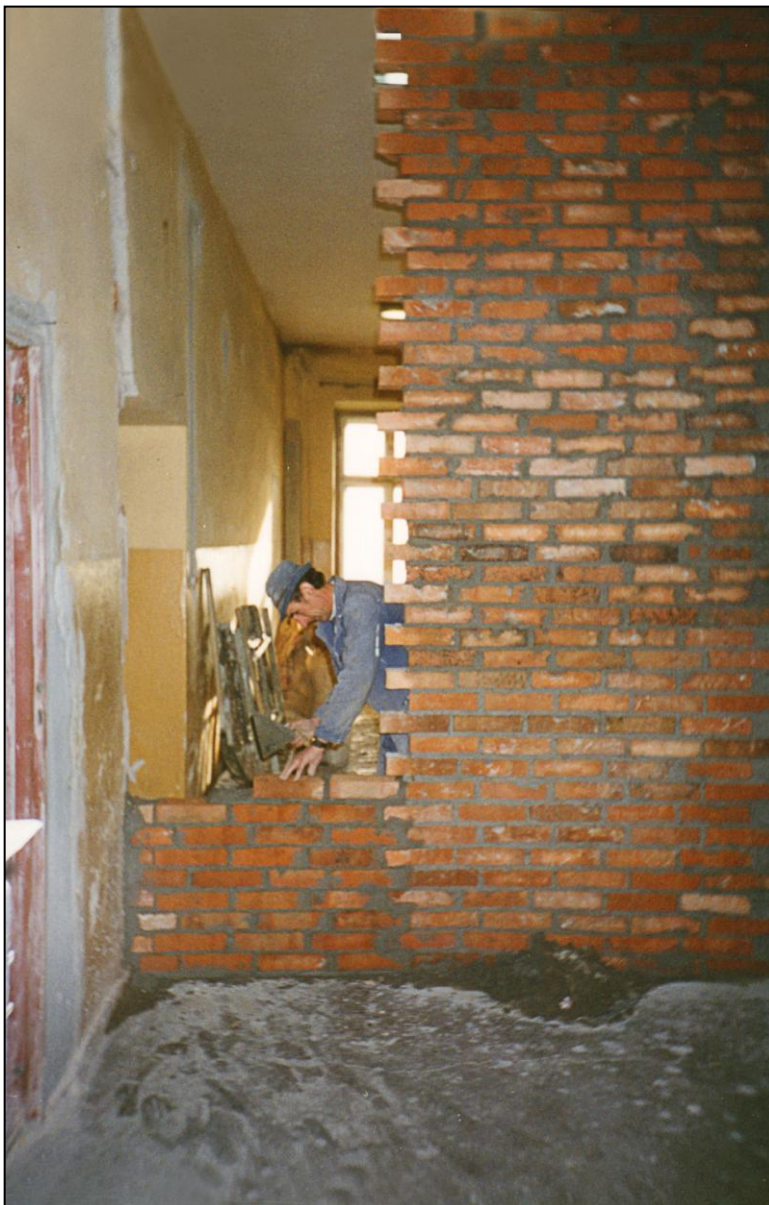
Przeróbka holu na pomieszczenie, gdzie obecnie znajduje się literatura piękna, biograficzna i wspomnieniowa.

kilkakrotnym wsparciu uczniów Zespołu Szkół Zawodowych i dzięki kilkudniowej pracy osób przyjeżdżających z Wojewódzkiego Ośrodka Doskonalenia Nauczycieli w Lesznie. W nowej siedzibie biblioteka rozpoczęła pracę 2 sierpnia, mimo że jeszcze odbywało się urządzenie pomieszczeń i remont na pierwszym piętrze. 221