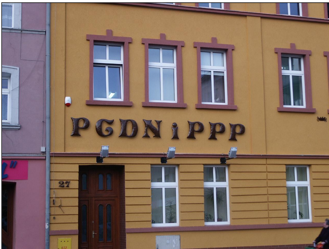
Budynek PCDN i PPP w Górze – na parterze Biblioteka Pedagogiczna (2007 r.)

dla czytelników. Drzwi od frontu zostały zamknięte, czytelnicy i inne osoby musieli wchodzić do budynku od podwórka. W takich warunkach i przy słabym świetle odbywało się wypożyczanie książek.