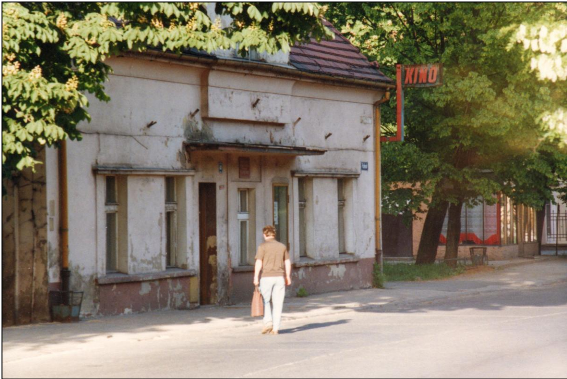
Siedziba Biblioteki Pedagogicznej od 1975 do 1993 r. (zdjęcie z 1993 r.)