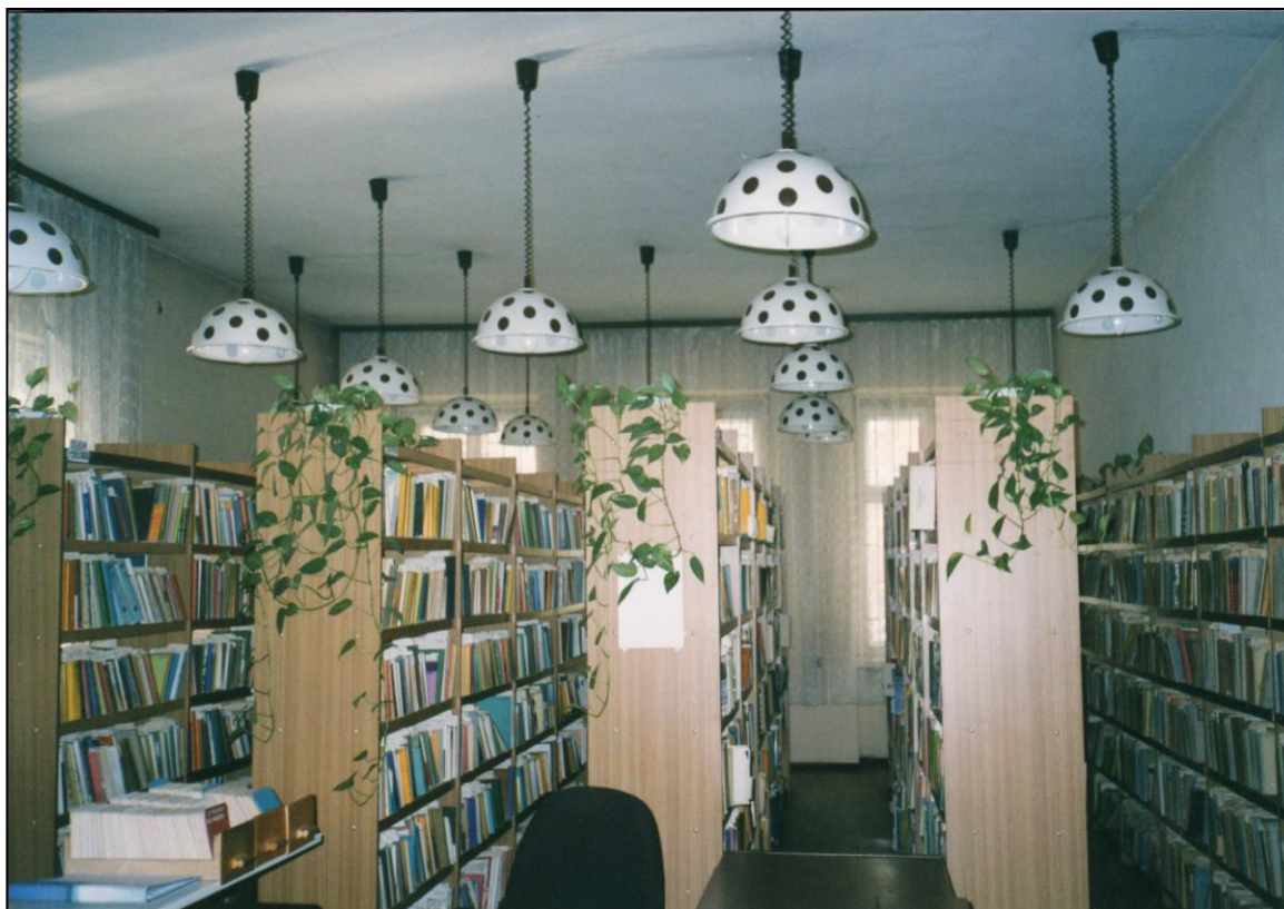
Wypożyczalnia (2000 r.)

utrudnienie w pracy ze względu na przeniesienie gabinetu kierownika biblioteki (na parter) i magazynu czasopism z I piętra do piwnicy.” 249