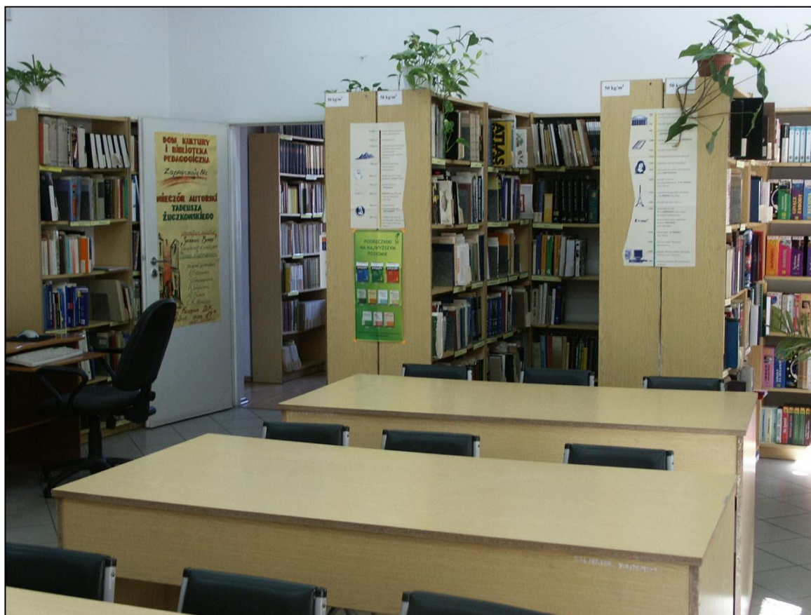
Czytelnia (2007 r.)

Nie ulega wątpliwości, że wpływ na liczbę odwiedzin miały komputery. Z chwilą pojawienia się tych urządzeń w czytelni zaczęła rosnąć liczba odwiedzin, a spadek zaczął się, gdy komputery i internet stały się powszechnie dostępne.