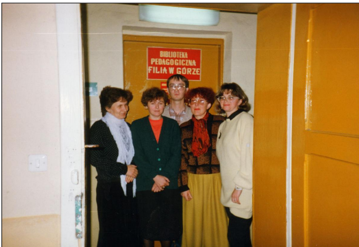
Pracownicy Biblioteki Pedagogicznej (w 1993 r.)

dysponowała wówczas w piwnicy dwoma magazynami książek (30,78 m 2 i 43,12 m 2 ); na parterze znajdowały się magazyn literatury pięknej powstały z holu – 31,5 m 2 ; wypożyczalnia z magazynem książek pedagogiczno-psychologicznych – 51,13 m 2 ; informatorium – 15,9 m 2 ; czytelnia – 49,76 m 2 ; magazyn czasopism – 15,08 m 2 ; dział opracowania – 11,68 m 2 ; na pierwszym piętrze: gabinet kierownika biblioteki – 14,28 m 2 i magazyn czasopism – 27,72 m 2 . Łącznie biblioteka zajmowała 342,22 m 2 powierzchni budynku. 219