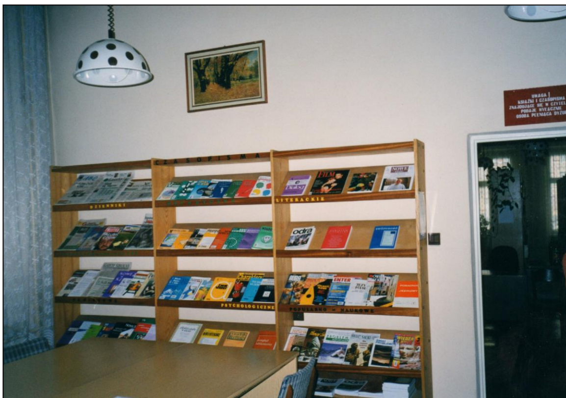
Czytelnia (2000 r.)

Gdy miejscowe starostwo zaczęło się interesować budynkiem, bo zamierzało go przejąć na własne potrzeby, ODNiKU przypomniał sobie o czynszach. W maju wymyślił wygórowaną stawkę - 16 zł za m 2 . Biblioteka musiałaby płacić miesięcznie ponad 5000 zł. Miałyby one obowiązywać od stycznia br. Żadna z instytucji nie zapłaciła ani złotówki. 250