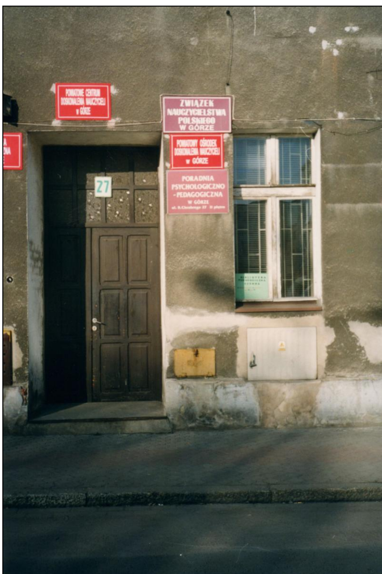
Wejście do budynku zajmowanego przez PCDN i PPP w Górze. Na parterze mieści się Biblioteka Pedagogiczna. (stan w 2001 r.)