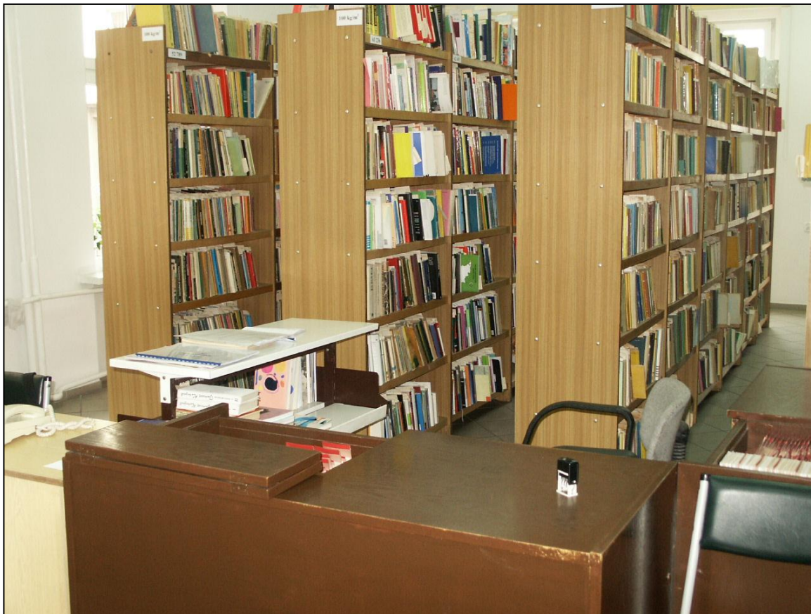
Wypożyczalnia (2007 r.)

się, gdy przygotowują swoje prezentacje maturalne. Łatwiejszym w dostępie źródłem informacji jest domowy komputer podłączony do internetu. Dzieje się tak za przyzwoleniem rodziców i nauczycieli. Nie widać szans na zmianę w tej grupie potencjalnych czytelników.