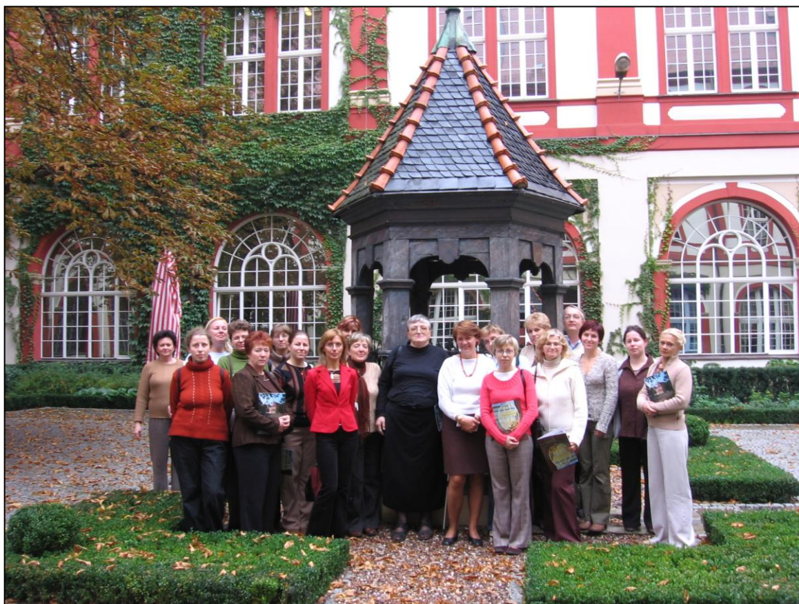
Członkowie Zespołu Samokształceniowego Nauczycieli-Bibliotekarzy na dziedzińcu Zakładu Narodowego im. Ossolińskich we Wrocławiu.

Ponieważ w spotkaniach uczestniczy nie więcej niż 20 osób z różnych szkół – podstawowych, gimnazjalnych, ponadgimnazjalnych – oraz z Biblioteki Pedagogicznej, trudno było znaleźć tematy, które by zainteresowały wszystkich.