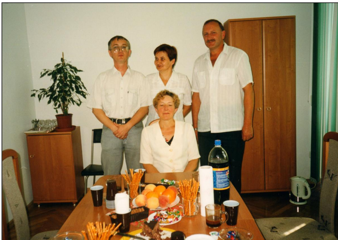
Pracownicy Biblioteki Pedagogicznej.