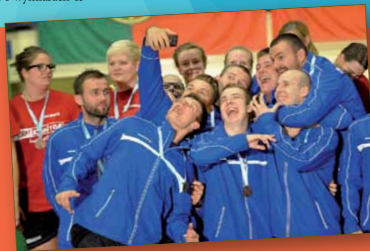
Brązowy medal Akademickich Mistrzostw Europy w piłce ręcznej dla Politechniki Opolskiej - 30 czerwca 2013 r.

Małopolskiej 22 w sąsiedztwie domu studenta i hotelu Sokrates. Na kompleks składa się sala sportowa do gier zespołowych o wymiarach 26,5 x 18,19 m gdzie odbywają się treningi i