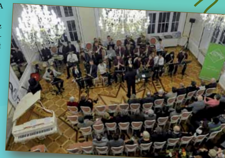
Z orkiestrą po zamkach i pałacach