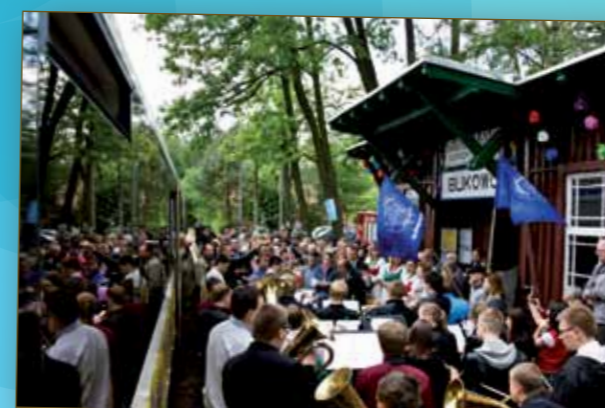
Opolski Ekspres Dęty na stacji w Bukowie

Zapraszamy bardzo serdecznie wszystkich chętnych do Orkiestry Politechniki Opolskiej (OPO)! Jeśli chcesz grać i rozwijać swoją pa-