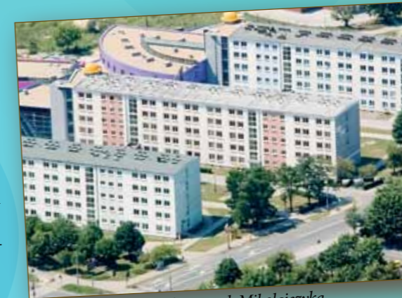
akademiki przy ul. Mikołajczyka