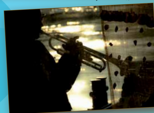
Z orkiestrą po Odrze