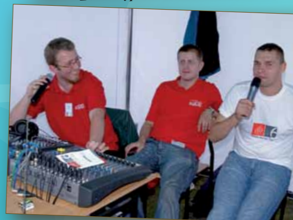
Załoga Radia Emiter