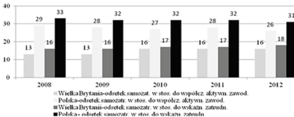
Rys. 2. Odsetek samozatrudnionych osób niepełnosprawnych w wieku produkcyjnym z ogółu aktywnych zawodowo oraz ogółu zatrudnionych osób niepełnosprawnych w wieku produkcyjnym w Wielkiej Brytanii i Polsce w latach 2008-2012 (w %)

Odmiennie przedstawia się sytuacja w zakresie odsetka samozatrudnionych osób niepełnosprawnych na tle ogółu aktywnych zawodowo, jak też zatrudnionych osób niepełnosprawnych (rys. 2). W Polsce w latach 2008-2012 osoby niepełnosprawne w wieku produkcyjnym, zaliczane do aktywnych zawodowo, zdecydowanie częściej wybierały samozatrudnienie jako formę aktywizacji zawodowej oraz formę zatrudnienia, niż osoby niepełnosprawne w Wielkiej Brytanii. W 2008 r. odsetek samozatrudnionych wśród aktywnych zawodowo osób niepełnosprawnych wyniósł w Polsce 29% i był większy niż w Wielkiej Brytanii o 16 p.p.