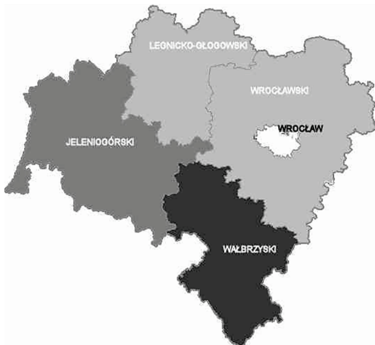
Rys. 2. Nasilenie cechy (stopa bezrobocia rejestrowanego) w podregionach województwa dolnośląskiego (stan na 31.12.2010 r.)

turą gospodarki oraz niewystarczającym procesem inwestycyjnym i restrukturyzacyjnym przekładają się na tendencje do wyludniania się części terenów Dolnego Śląska. Ucieczka ludności jest wielokierunkowa, np. do aglomeracji miejskich, za granicę (z tym że w dobie kryzysu miejsca pracy w innych krajach również się kurczą).