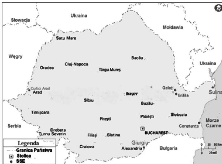
Rys. 2. Rozmieszczenie SSE w Rumunii