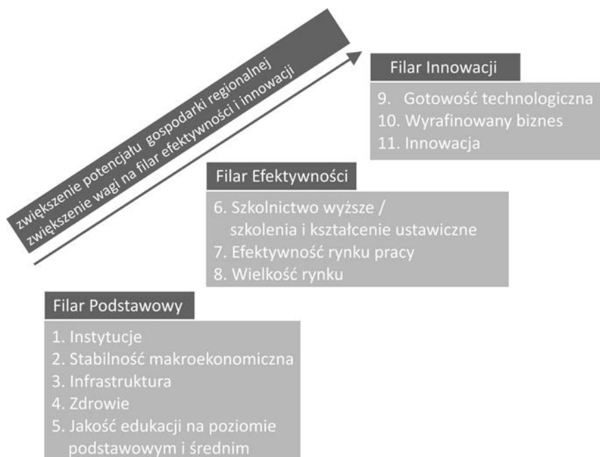
Rys. 1. Filary wskaźnika RCI

i ich komponenty merytoryczne (zaprezentowane na rys. 1), służące do określenia zarówno krótkoterminowych, jak i długoterminowych możliwości konkurencyjnych regionów.