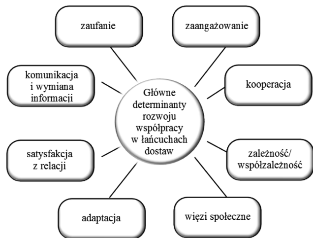
Rys. 1. Główne determinanty rozwoju współpracy w łańcuchach dostaw

W kolejnym etapie transakcje mogą być powtarzane, stopniowo prowadząc do ustanowienia relacji opartych na umowach krótkookresowych. Jeżeli współpraca jest udana, to relacje mogą przekształcić się w bazujące na lojalności i zaufaniu powiązania długoterminowe. Elementami wpływającymi na rozwój kooperacji oraz oparcie współpracy w łańcuchach dostaw na mechanizmach relacyjnych ( relational governance ) są [Ryciuk, 2016, s. 57]: zaufanie, następnie zaangażowanie, komunikacja/wymiana informacji, współpraca w dążeniu do wspólnych celów, satysfakcja z relacji, zależność/współzależność, adaptacja oraz więzi społeczne i relacje interpersonalne (rys. 1). Uwzględniając czas, intensywność i zakres współpracy między ogniwami łańcucha dostaw, można wyróżnić: partnerstwo operacyjne i partnerstwo strategiczne. Partnerstwo strategiczne, w którym przedsiębiorstwa postrzegają partnera jako „przedłużenie” własnej organizacji, osiągnięcie celów wspólnych jest nadrzędne w stosunku do celów jednostkowych i nie ma określonego terminu zakończenia współdziałania. Należy zauważyć, że partnerstwo jest hybrydową formą współpracy i ma cechy zarówno konkurencji, jak i współpracy [Ploetner, Ehret 2006, s. 6].