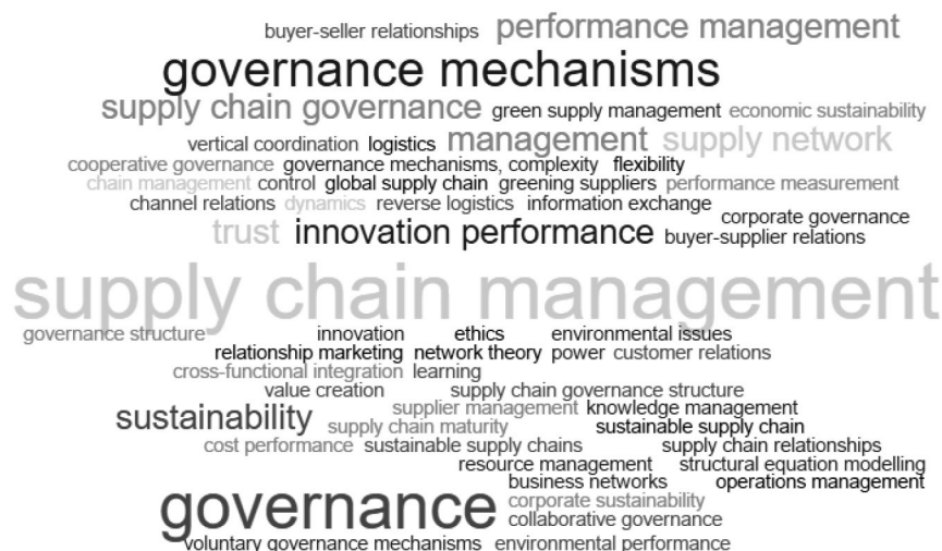
Rys. 3. Analiza słów kluczowych dokonana na podstawie stworzonej chmury słów