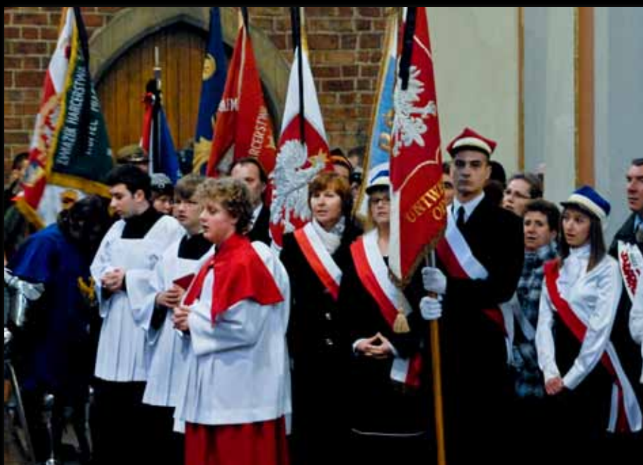
wśród pocztów sztandar Politechniki Opolskiej