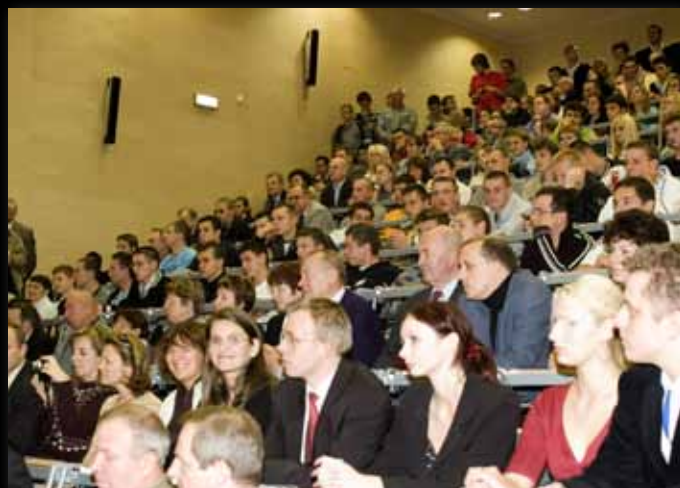
na spotkanie z prezydentem przyszło mnóstwo młodych ludzi

W całym kraju oddawano cześć prezydentowi, jego małżonce i pozostałym ofiarom katastrofy pod