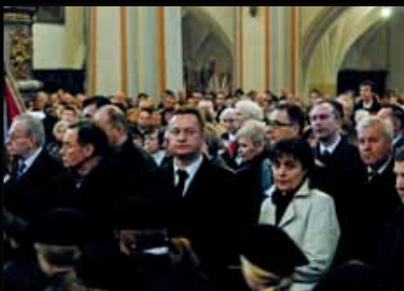
Wojewoda Opolski Ryszard Wilczyński z małżonką