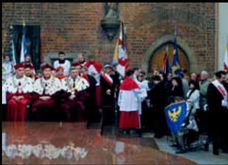
msza św. w intencji ofiar