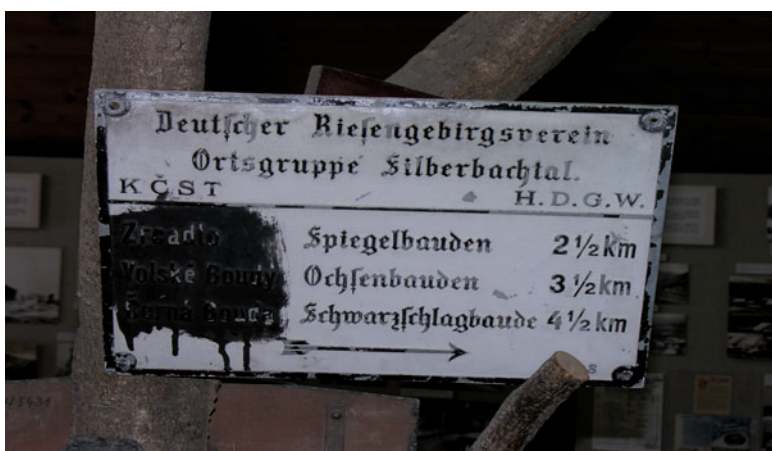
Drogowskaz DRGV z zamalowanými českými napisami. Ze zbiorów Krkonošského muzea v Vrchlabi

Napisy na drewnie okazały się nietrwałe w trudnych, górskich warunkach. W 1885 r. wprowadzono ulepszenie polegające na umieszczeniu informacji na metalowych tabliczkach, które przybijano do drewnianych podstaw i następnie całość mocowano na drewnianych słupach. Drogowskazy dostarczała towarzystwu za darmo firma Prospera Piette-Rivage. Sekcje składały bezpośrednio do niej zamówienia na wykonanie oznakowania dla konkretnego miejsca. W latach 1885–1886 ustawiono 103 drogowsskazy. Akcją znakowania nadzorował z ramienia ZG Eduard Petrák, który w 1886 r. wykonał mapę gór w skali 1:25 000 i zazaczył na niej 50 planowanych szlaków 75 .