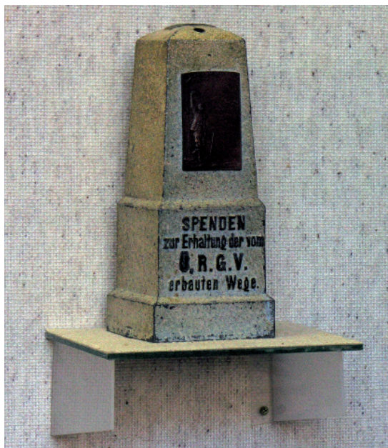
Skarbonka OeRGV Ze zbiorów Krkonošského muzea v Vrchlabí

„Das Riesengebirge in Wort und Bild”. W 1903 r. wprowadzono opłatę 1 fl za prenumeratę „Der Wanderer im Riesengebirge”. W 1909 r. zrezygnowano z utrzymania części dróg, ograniczono subwencje dla sekcji, a w 1911 r. nowym źródłem dochodu stały się bloczki kelnerskie, które, jak się spodziewano, miały przynieść większy zysk niż znaczki na utrzymanie dróg sprzedawane od 1909 r. po 2 halerze. W 1912 r. zamówiono w firmie braci Stegmann w Czeskich Budziejowicach 30 skarbonek z herbem towarzystwa, które rozmieszczono w schroniskach. Te ostatnie w 1915 r. przyniosły 102,62 K 67 .