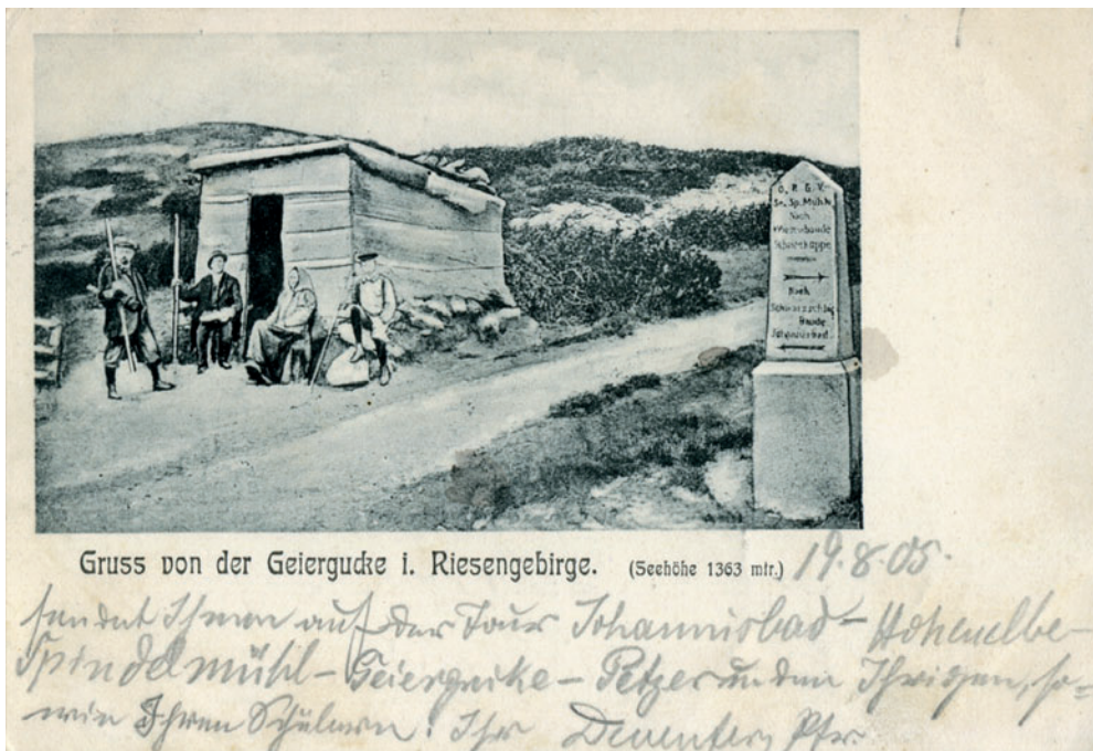
Výrovka w 1905 r.