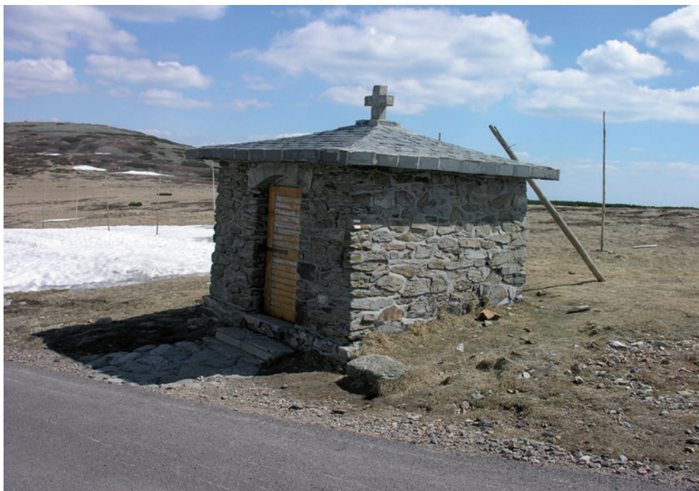
Kaplica koło Luční hory. Obecnie pomnik ofiar gór