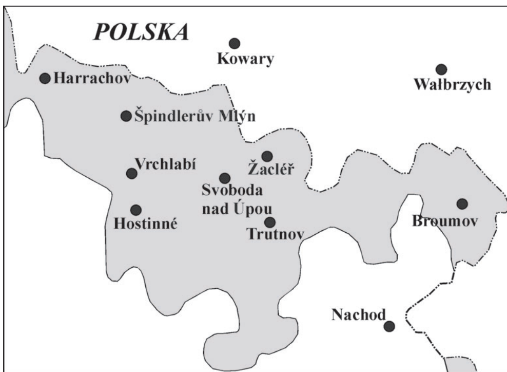
Niemiecki obszar językowy

on przejść pod zarząd miasta Vrchlabí na okres maksimum 10 lat. Gdyby w tym okresie nie powstała organizacja o celach podobnych do DRGV, to majątek miał stać się własnością Muzeum Karkonoskiego we Vrchlabí (§ 31). Przez cały omawiany okres liczba członków stopniowo rosła, osiągając 4 367 w 1925 r. 29