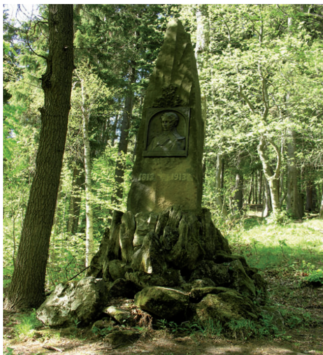
Pomnik Theodora Körnera