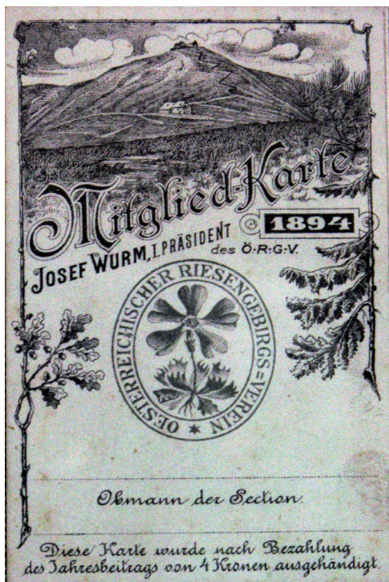
Legitymacja członkowska z 1894 r.

wzięciom odległym od zainteresowań zwykłego członka. Ze sprawozdań znikają informacje o wycieczkach, spotkaniach i prelekcjach. W końcu, ku niezadowoleniu osób zrzeszonych, zlikwidowano w 1898 r. „Das Riesengebirge in Wort und Bild”, ogłaszając, że pismem organizacyjnym jest „Der Wanderer im Riesengebirge”. W 1903 r. przestano go również dostarczać członkom za darmo. Brak własnego czasopisma powodował rozluźnienie więzi pomiędzy centralą a sekcjami, zwłaszcza tymi mniejszymi i odległymi od Karkonoszy. Luki tej nie były w stanie wypełnić rozsyłane sekcjom „Mitteilungen”, zawierające początkowo sprawozdania z posiedzeń ZG i walnych zebrań, a potem dla oszczędności tylko te ostatnie. Nieuniknione okazały się reformy. W 1909 r. zrezygnowano z utrzymywania części dróg, a w 1912 r. rozpoczęto wydawanie „Jahrbuch des Oesterreichischen Riesengebirgsvereines” 22 .