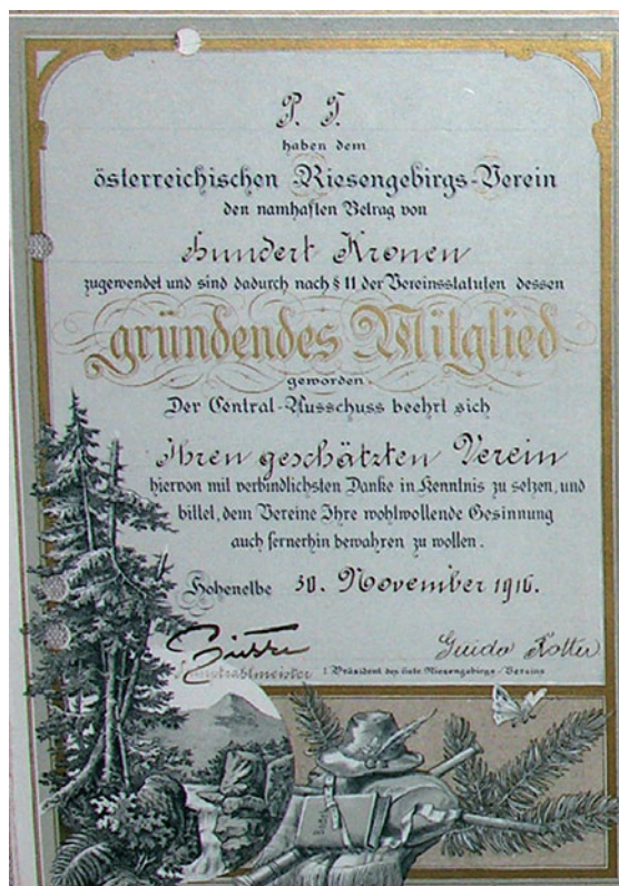
Dokument potwierdzający zapłacenie składki przez członka-założyciela