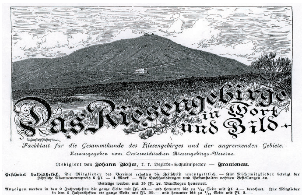
Winieta pisma „Das Riesengebirge in Wort und Bild”