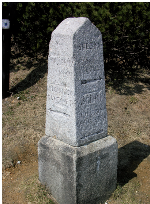
Drogowskaz koło Výrovki