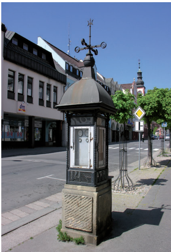
Domek meteorologiczny we Vrchlabí

w Berlinie i Wiedniu. W 1898 r. ustalono, że stację zbuduje państwo pruskie za kwotę 44 000 marek, a dobra Schaffgotschów wydzierżawią grunt pod budowę. Budowę rozpoczęto w lipcu 1899 r., a 5 VII 1900 r. została otwarta 217 .