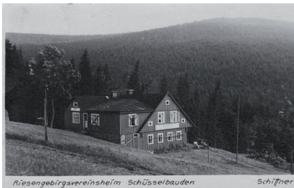
Dom w Dolní Mísečkach