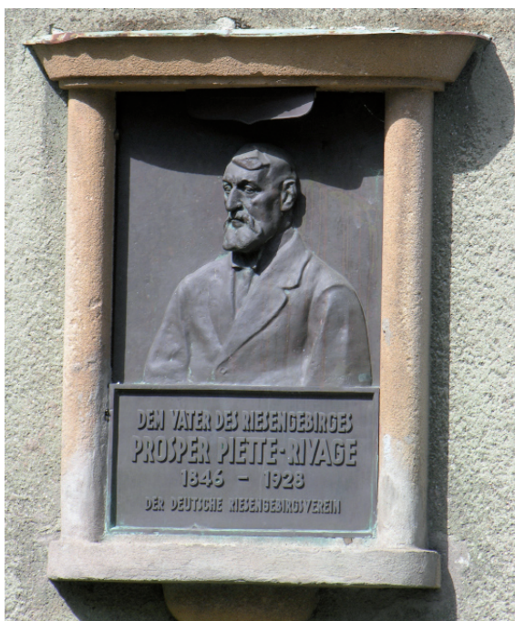
Tablica ku czci Prospera Piette-Rivage