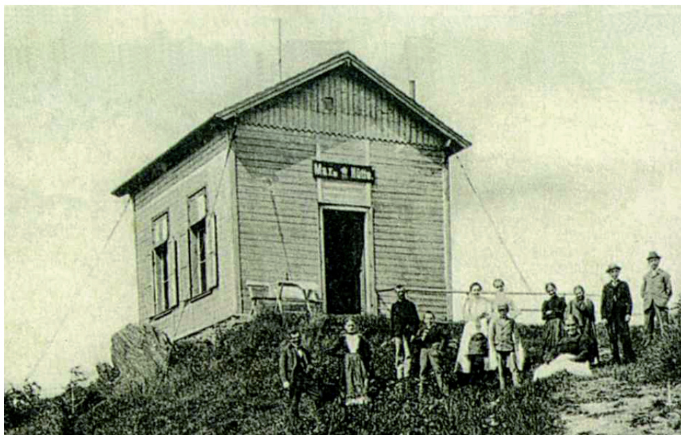
Schronisko Maxovka w XIX w.