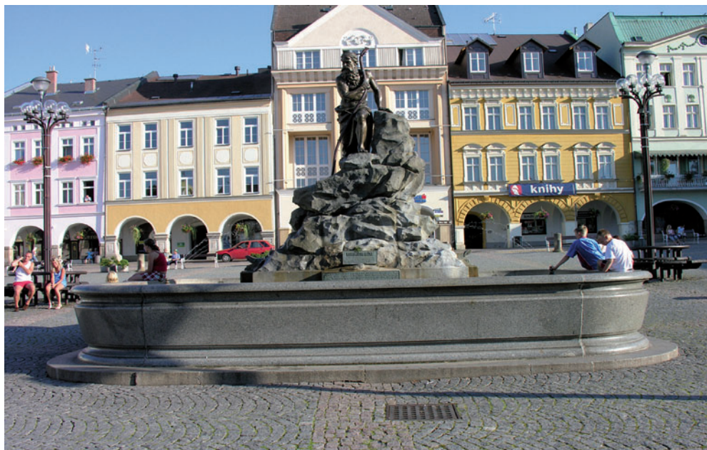
Studnia Karkonosza w Trutnovie