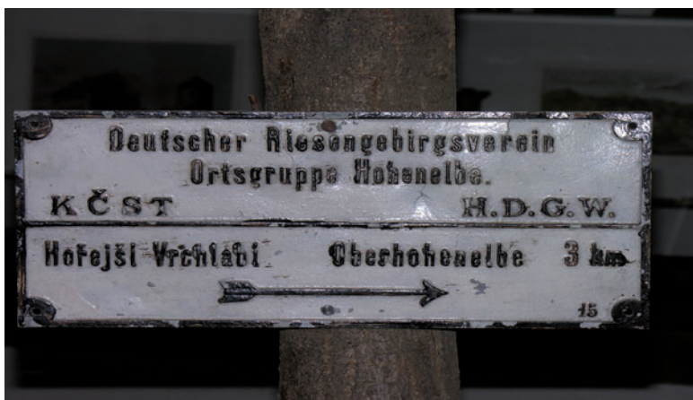
Dwujęzyczny drogowsskaz DRGV.