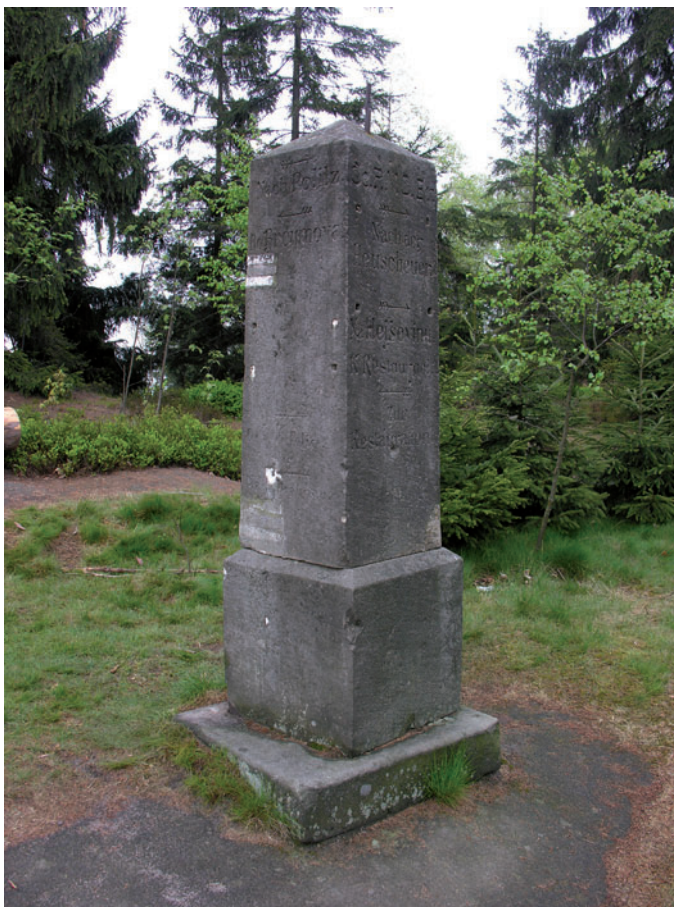
Kamienny drogowksaz sekcji Broumov OeRGV koło Hvězdy

działalności towarzystwa. Do napraw używano gorszej farby, którą szybko zmywały deszcze. Po zakończeniu konfliktu południowe Karkonosze znalazły się na terenie Czechosłowacji. Zniszczono sporo tablic z niemieckimi napisami. W 1920 r. rozpoczęły się rozmowy z KČT w sprawie zasad znakowania. Zmieniła się także sytuacja własnościowa w wyniku upaństwowienia terenów, poprzez które biegły szlaki. Początkowo oznakowanie odnawiano według starych zasad. Problemem nadal była kiepska jakość farby – brakowało farb wodo- i światłoodpornych. W 1924 r. ze względów oszczędnościowych i estetycznych postanowiono ograniczyć liczbę tablic informacyjnych. Uznano, że góry oszpecają zwłaszcza reklamy właścicieli schronisk. W 1928 r. DRGV zawarł umowę o podziale terenu znakowania w Karkonoszach, odstępując czeskiej organizacji część dróg. Towarzystwo zostało do tego kroku zmuszone, ale równocześnie zyskało na tym posunięciu finansowo. Rozpoczęto także wymianę na znakowanie dwujęzyczne. Należało wymienić około 250 tablic. Były to jak się wydaje, zbyt optymistyczne szacunki. Na prace uzyskano 7000 Kč (minus 70 Kč kosztów) dotacji. Kwota ta wystarczyła na wymianę ok. 50 tablic. Pozostałe planowano wymienić w ciągu 4 lat, o ile władze przyznają dotacje na dotychczasowym poziomie. Prace rozpoczęto we wschodnich