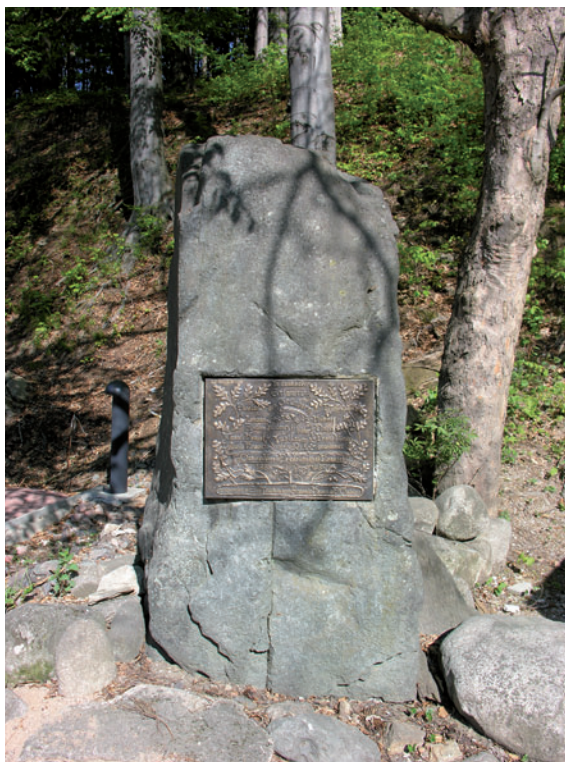
Pomnik sekcji Bedřichov-Labská