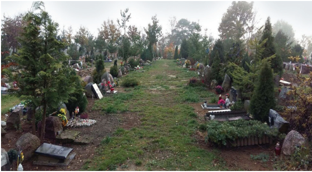
Il. 2. Grzebowisko Brzozowa Przystań, Mochle (źródło: http://brzozowaprzystan.pl/wp-content/uploads/2015/11/cmentarz_dla_zwierza_bydgoszcz-3.jpg [data dostępu: 7.08.2017])

Fig. 2. Pet cemetery Brzozowa Przystań in Mochle (source: http://brzozowaprzystan.pl/wp-content/uploads/2015/11/cmentarz_dla_zwierza_bydgoszcz-3.jpg [accessed: 7.08.2017])