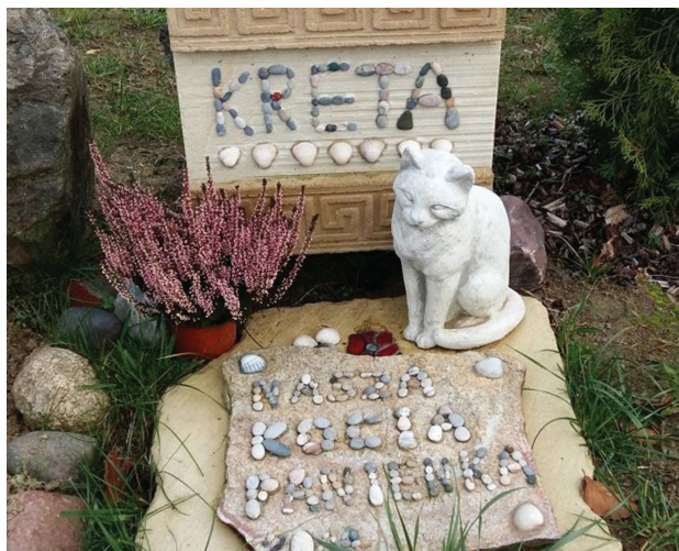
Il. 4. Mochle, grzewisko Brzozowa Przystań – nietypowy nagrobek (źródło: http://brzozowaprzystan.pl/galeria/_cmentarz-dla-zwierzat-mochle-kolo-bydgoszczy-7/ [data dostępu: 7.08.2017])

Fig. 4. Mochle, pet cemetery Brzozowa Przystań – unconventional gravestone (source: http://brzozowaprzystan.pl/galeria/_cmentarz-dla-zwierzat-mochle-kolo-bydgoszczy-7/ [accessed: 7.08.2017])