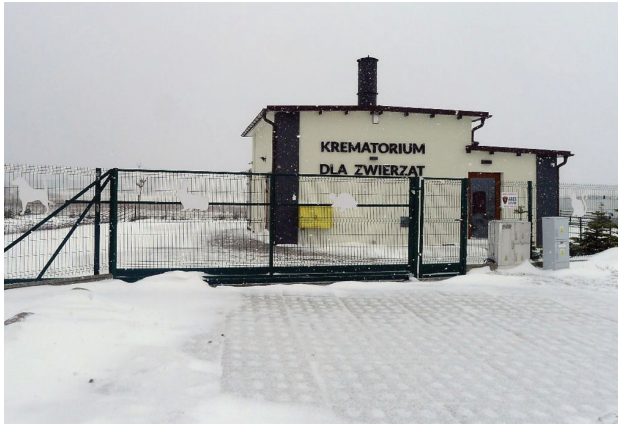
Il. 6. Gdańsk, grzebowisko Zawsze Razem