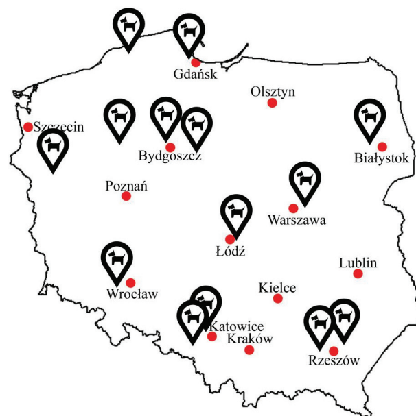
Il. 1. Rozmieszczenie grzebowisk dla zwierząt w Polsce (oprac. A. Myślińska)