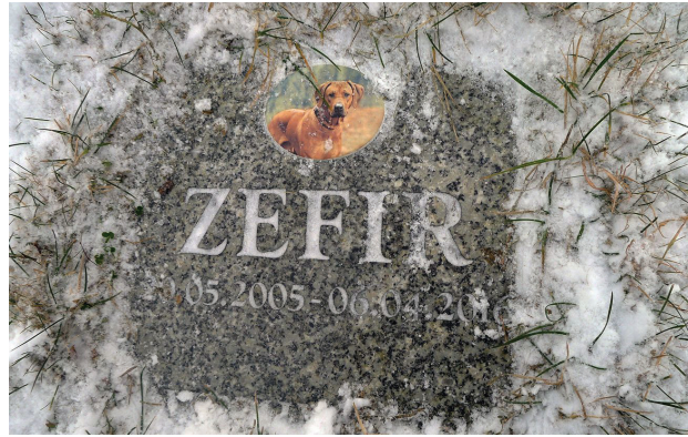
Il. 3. Gdańsk, grzebowisko Zawsze Razem – typowy nagrobek

Podczas prowadzenia badań nie znaleziono w Polsce nagrobków mających znaki religijne takie jak krzyże czy wizerunki świętych. Występują one natomiast w Niemczech, np. na cmentarzu w Monachium. Znajduje się tam figura